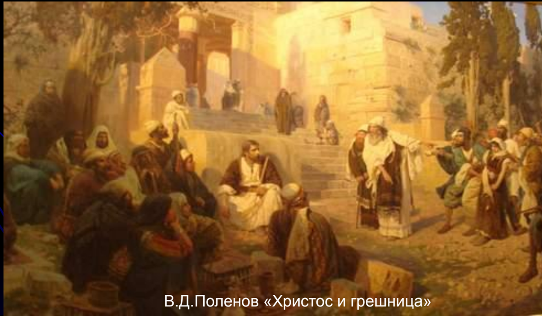
В.Д.Поленов «Христос и грешница»

Грешит из-за любви к ближнему(крадет деньги, чтобы прокормить блудницу)