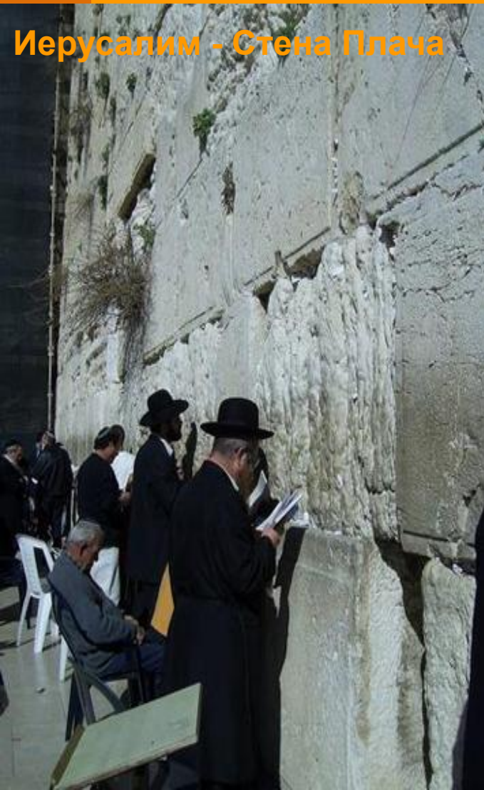
Иерусалим - Стена Плача

Население составляет 5 433 134 человека (1995), включая 122 000 еврейских поселенцев в районе Западного Берега, 14 500 - в районе Голанских высот, 4800 - в секторе Газа и 149 000 - в Восточном Иерусалиме. Средняя плотность населения около 262 человек на км 2 . Большинство жителей - евреи (83%), остальные - арабы 17%. Официальный язык еврейский (иврит), среди арабского населения официальный язык - арабский, распространены так же английский, идиш, русский язык. Иудейскую религию исповедует 82% населения, мусульмане (главным образом сунниты) - 14%, христианство - 2%. Рождаемость - 20,39 новорожденных на 1 000 человек (1995). Смертность - 6,38 смертельных исхода на 1 000 человек (уровень детской смертности - 8,4 смертельных исхода на 1 тыс. Новорожденных). Средняя продолжительность жизни: мужчины - 76 лет, женщины - 80 лет.