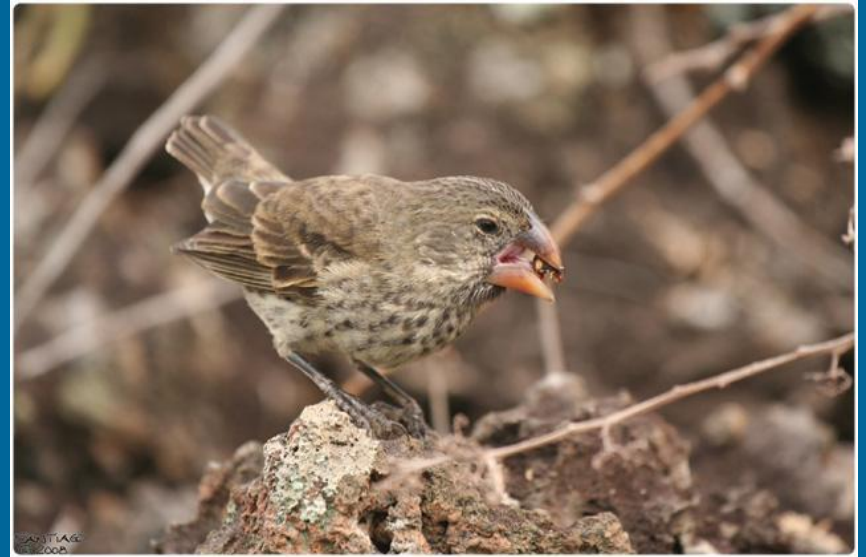
Земляной вьюрок Galapagos Journey.