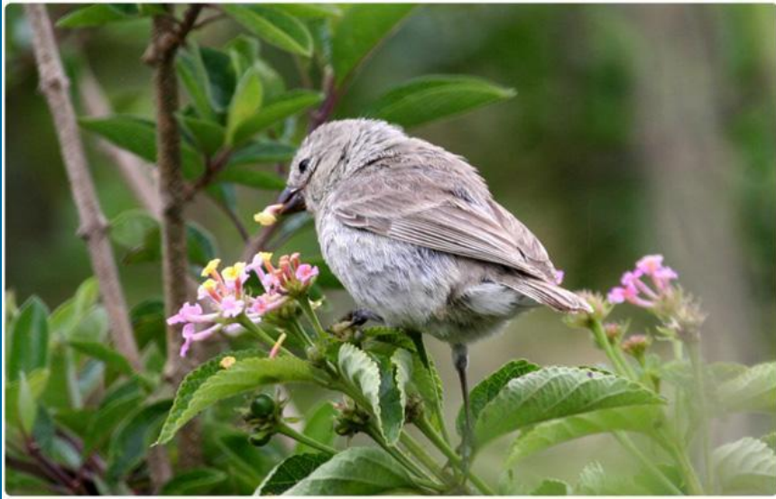
Большой кактусовый вьюрок Galapagos Journey.