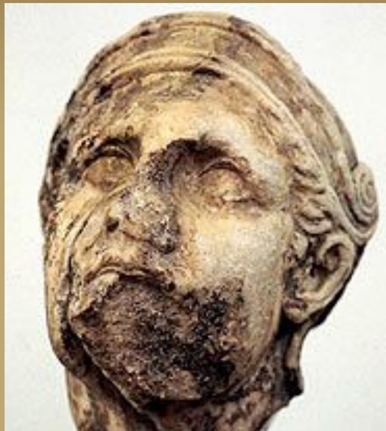
Голова раненого воина.

Деталь рельефа из Галикарнасского Мавзолея.