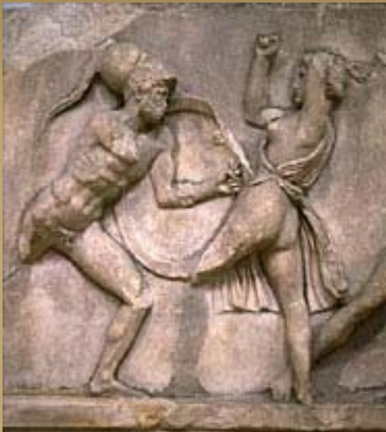
Битва греков с амазонками.

Деталь рельефа из Галикарнасского Мавзолея.