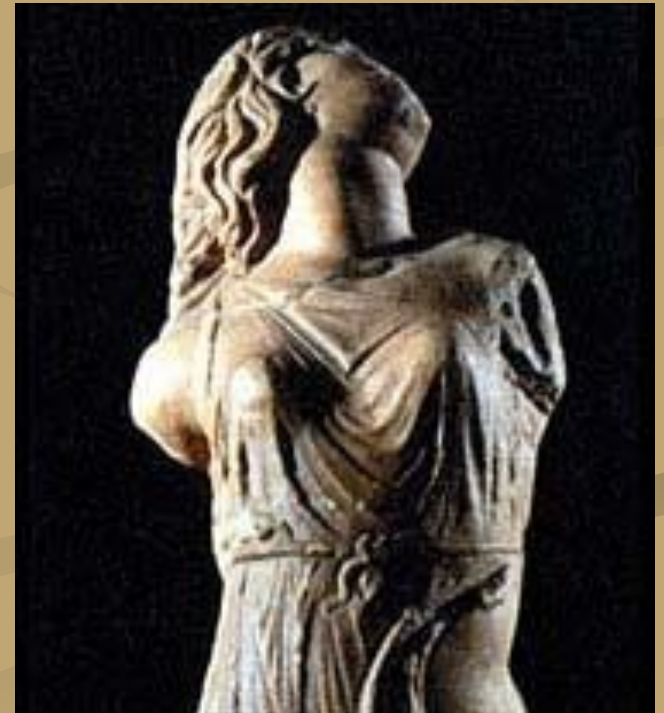
Менада. 4 в. до н.э.