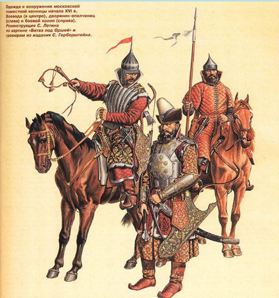
Одежда и вооружение московской поместной конницы начала XVI в. Воевода (в центре), дворянин-ополченец (слева) и боевой холоп (справа). Реконструкция С. Летина по картине «Битва под Оршей» и гравюрам из издания С. Герберштейна.

Поместная конница: воевода, дворянин-ополченец и боевой холоп