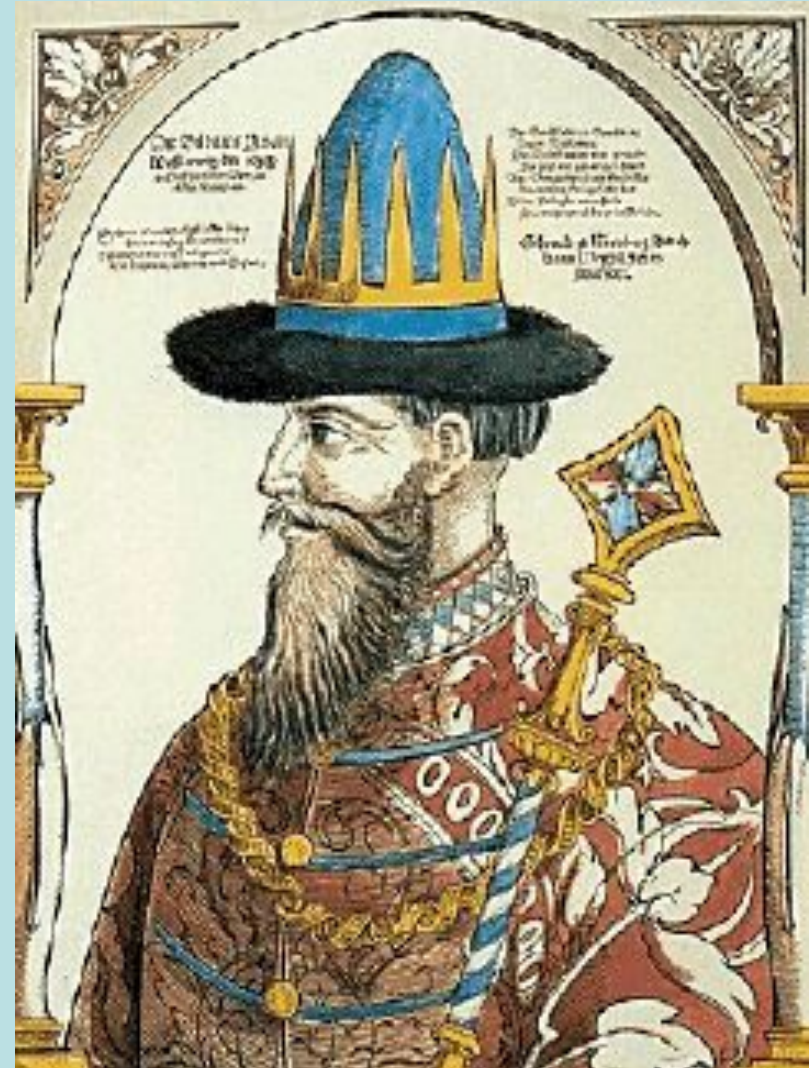
Иван IV. Старинная немецкая гравюра