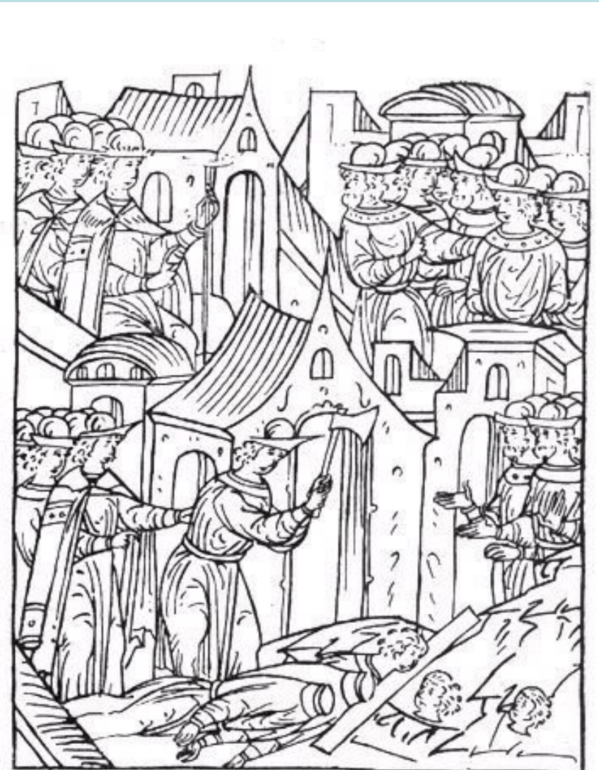
Казни бояр в 1546 г.

Первый приказ о казни отдал в 13 лет – велел псарям убить князя Андрея Шуйского