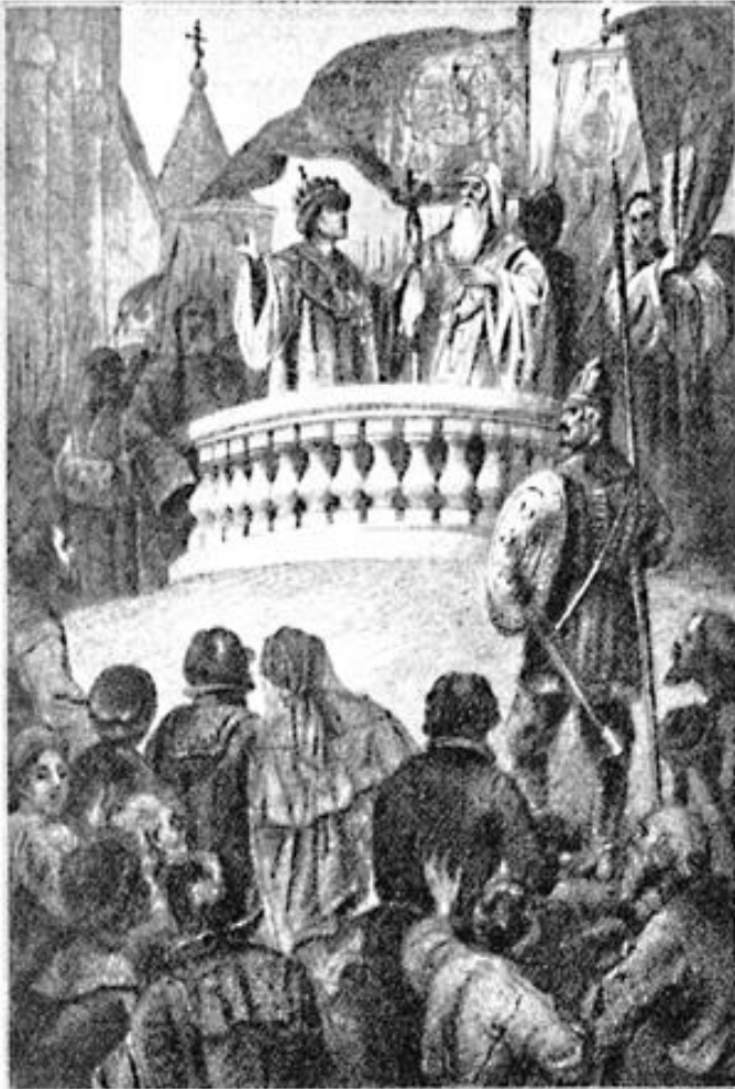
Иван IV держит речь перед народом на Земском соборе 1550 г.

❖ Земские соборы – совещания власти с представителями основных групп населения