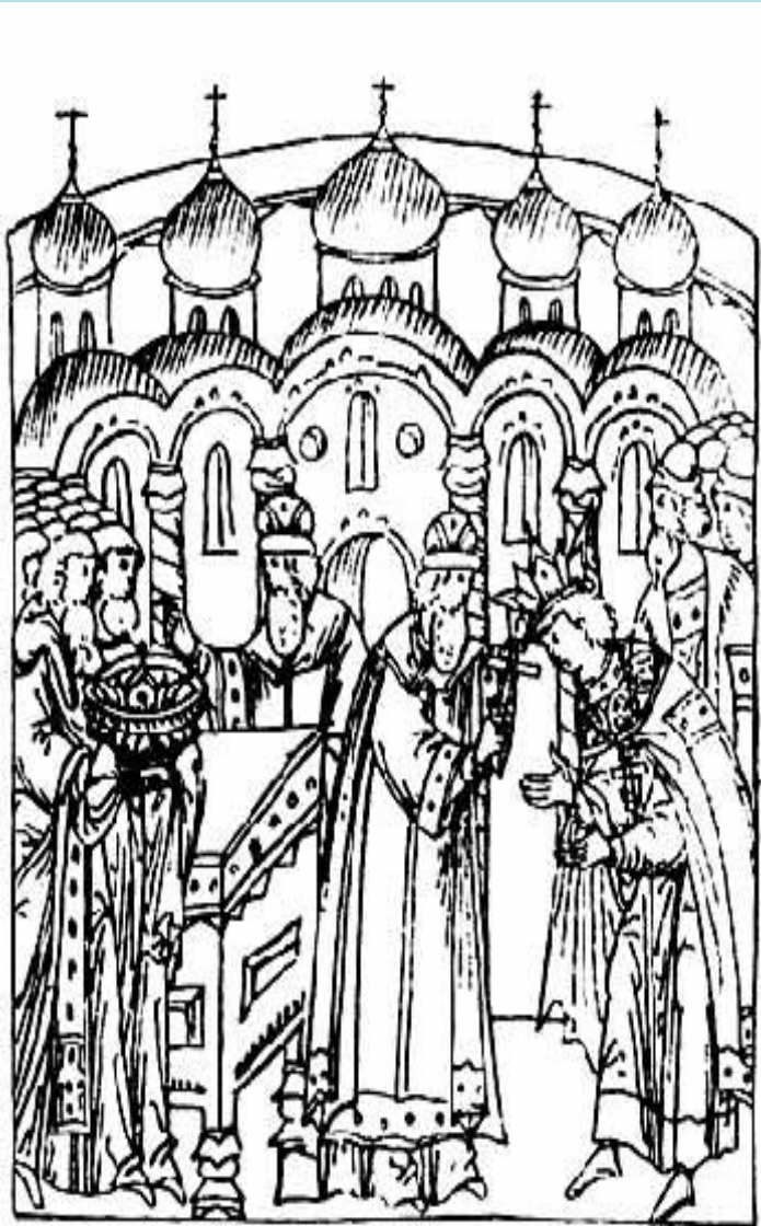
Венчание Ивана IV на царство