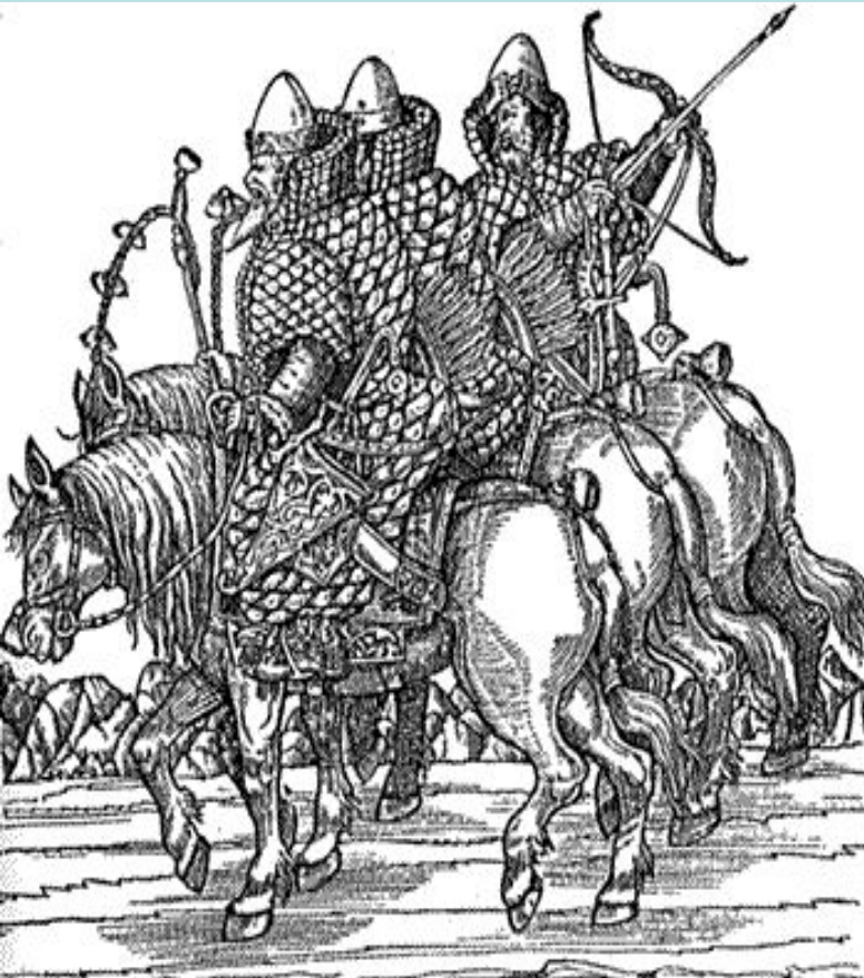
Русские всадники. Из «Записок» С. Герберштейна. 1566 г.

С каждых 100 четвертей земли – 1 вооруженный человек на коне