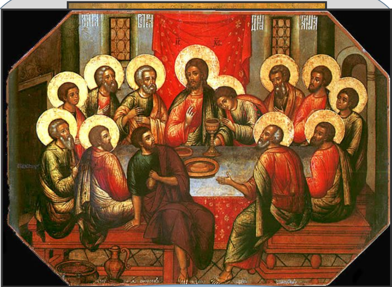
Симон Ушаков. «Тайная вечеря». Икона XVII века