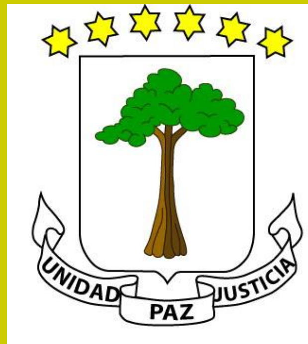
герб Экваториальной Гвинеи