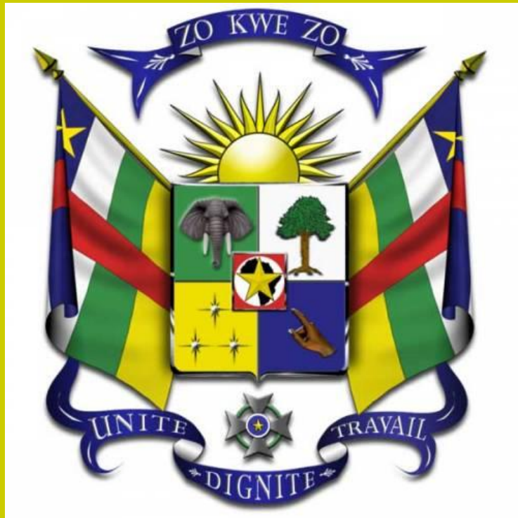
герб Африканской Республики