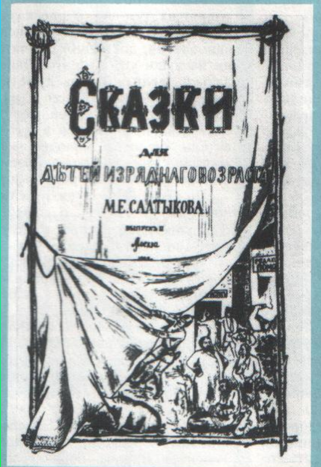
СКАЗКИ ДЛЯ ДЕТЕЙ ИЗРЯДНОГО ВОЗРАСТА. Обложка нелегального издания 1884 года.

Все сказки Щедрина подвергались цензурным гонениям. Сказка «Богатырь» при жизни писателя не могла быть напечатана и увидела свет только после революции.