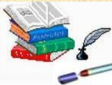
Иоганн Георг Гмелин.

В 1735 г. участники Великой северной экспедиции академики Г.Ф. Миллер и И.Г Гмелин 6 месяцев провели в Забайкалье, побывали в долинах реки Ингода, Шилка, Аргунь, описали посещенные места и составили карту Забайкалья.