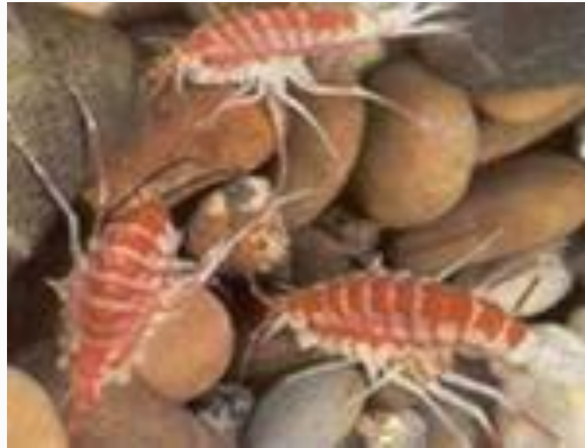
Бокоплав- рачки, освоившие всю толщу озера.