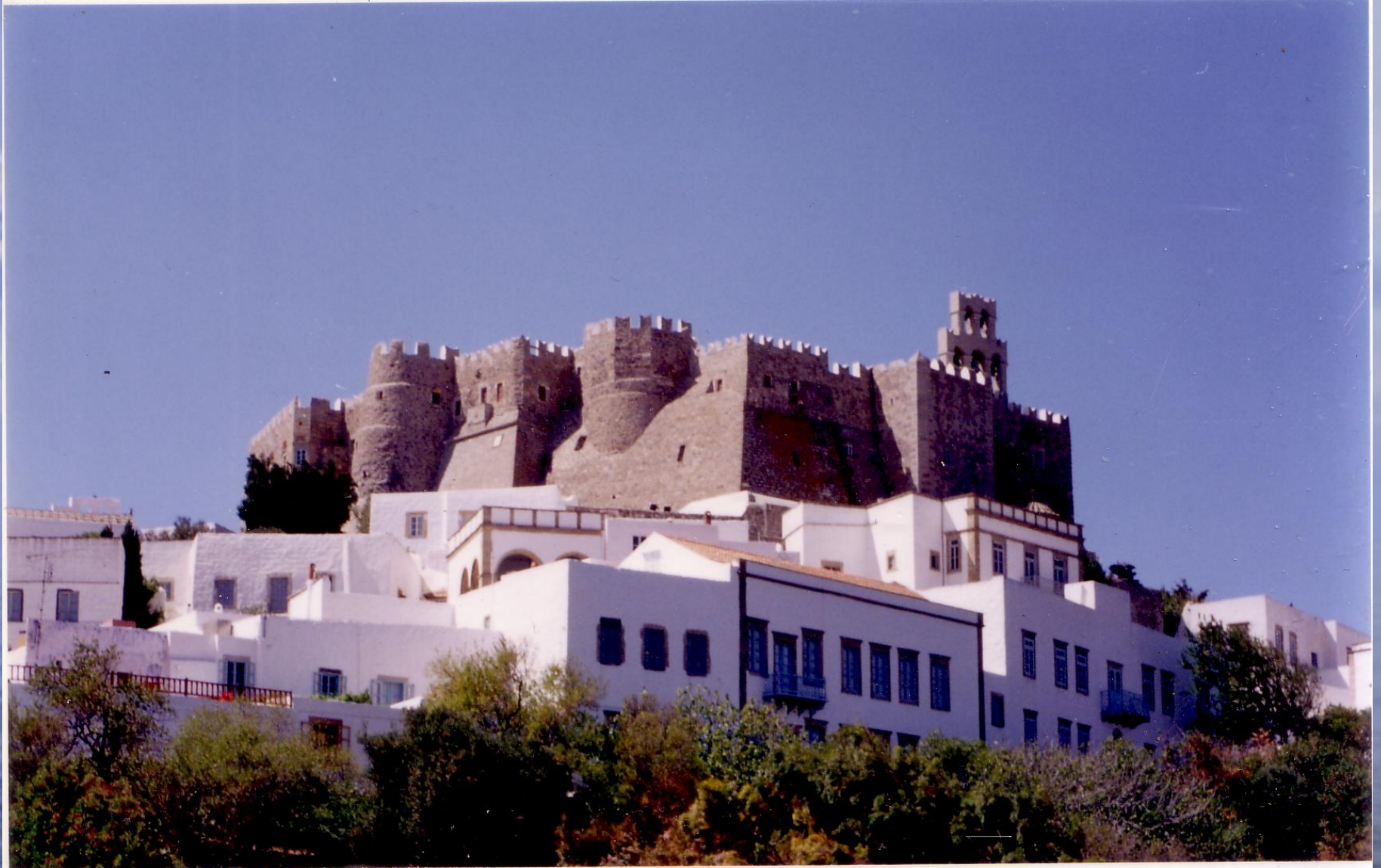
Монастырь Иоанна Богослова на острове Патмос