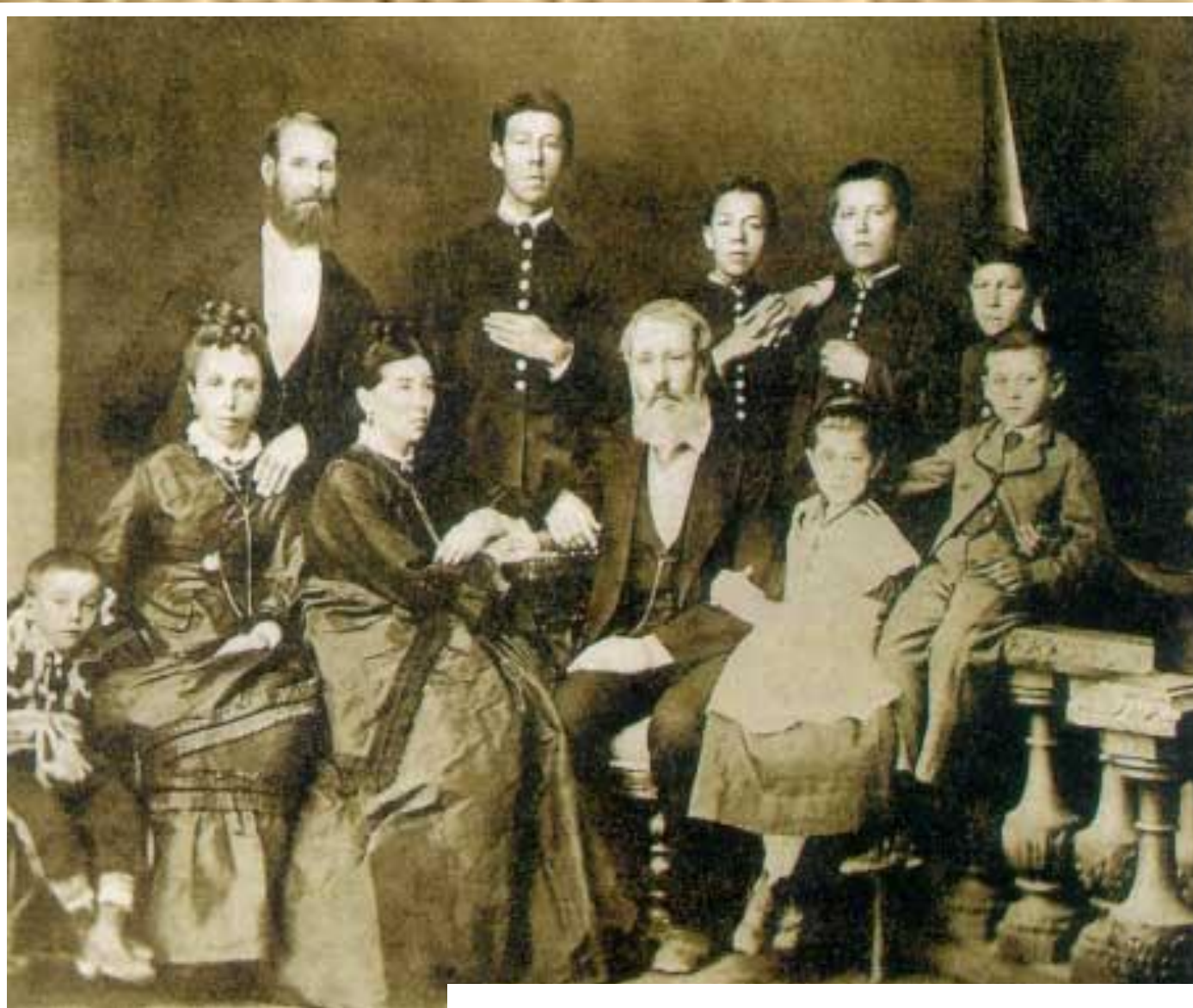
Семья Чеховых. 1874