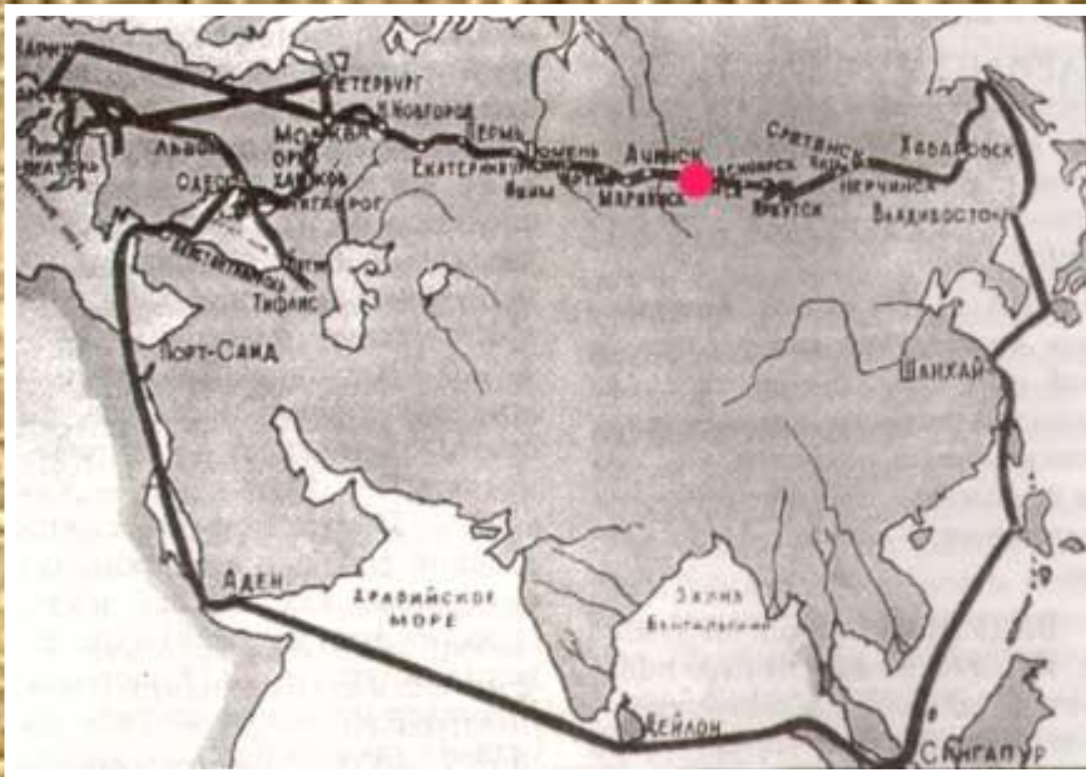
Карта пути А.П. Чехова на Сахалин и возвращение домой в 1890-1891 гг.