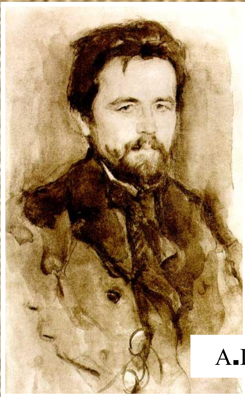
А.П. Чехов. 1902 г.