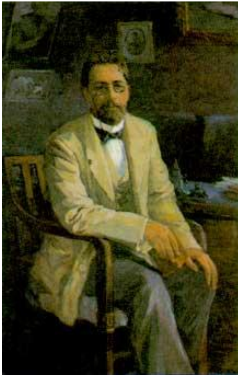
Портрет А.П. Чехова