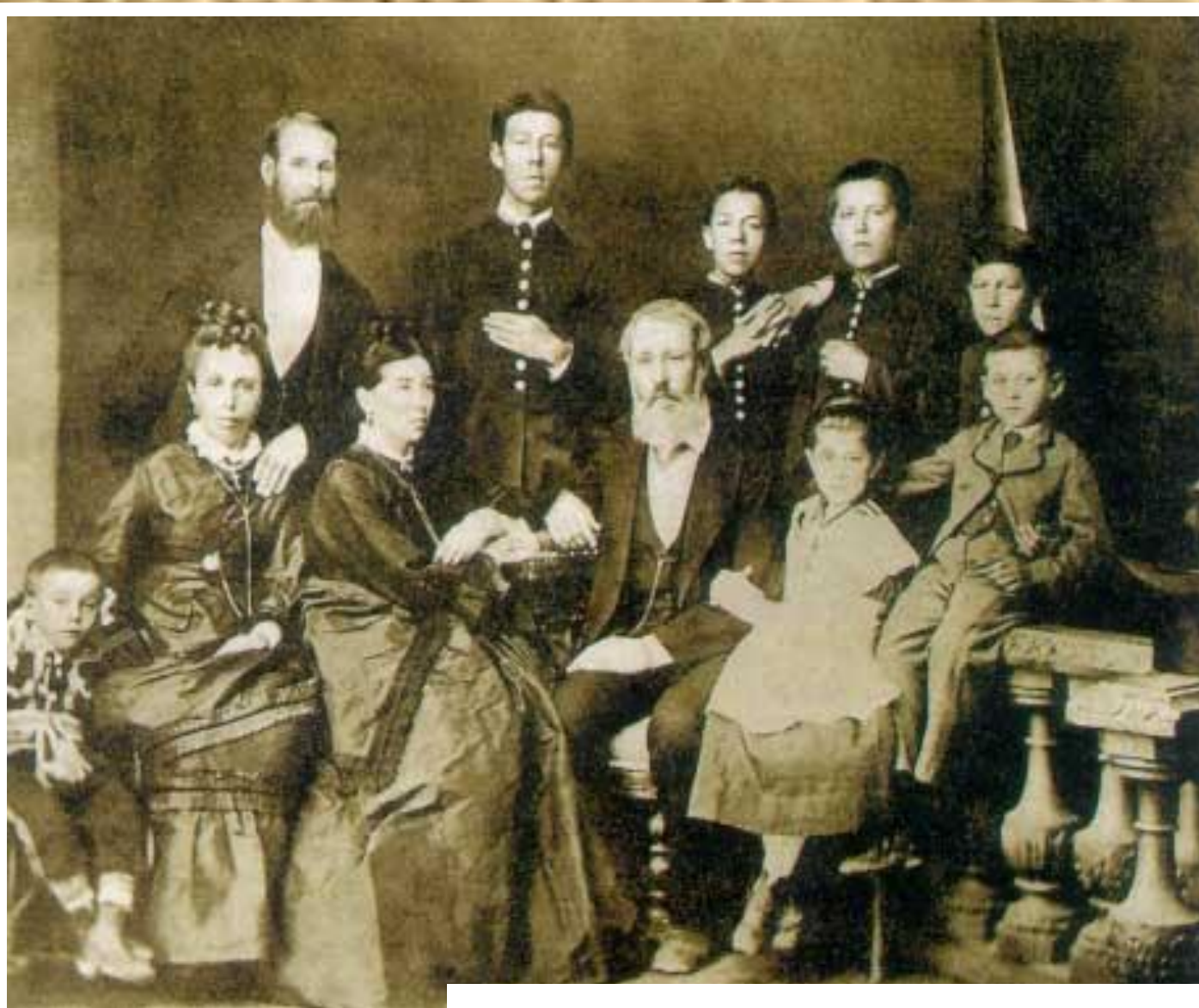
Семья Чеховых. 1874