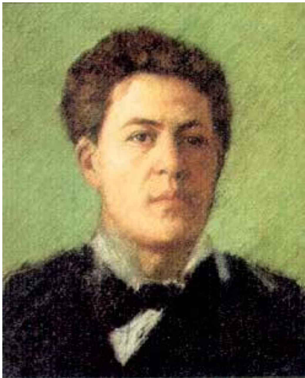
Портрет МОЛОДОГО Чехова