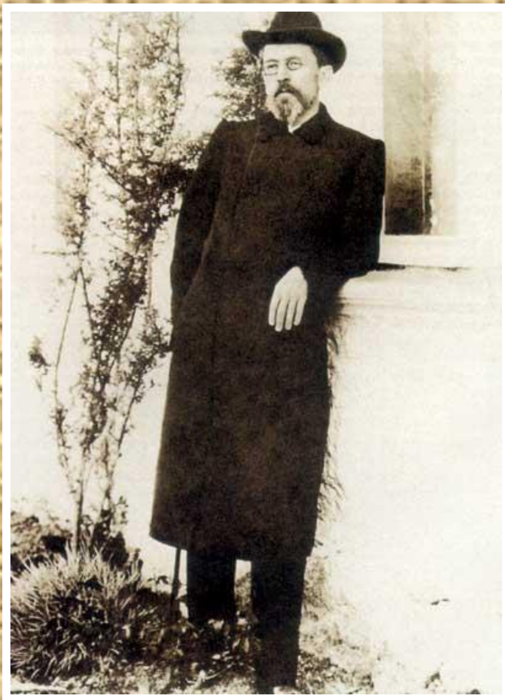
А.П. Чехов в Ялте