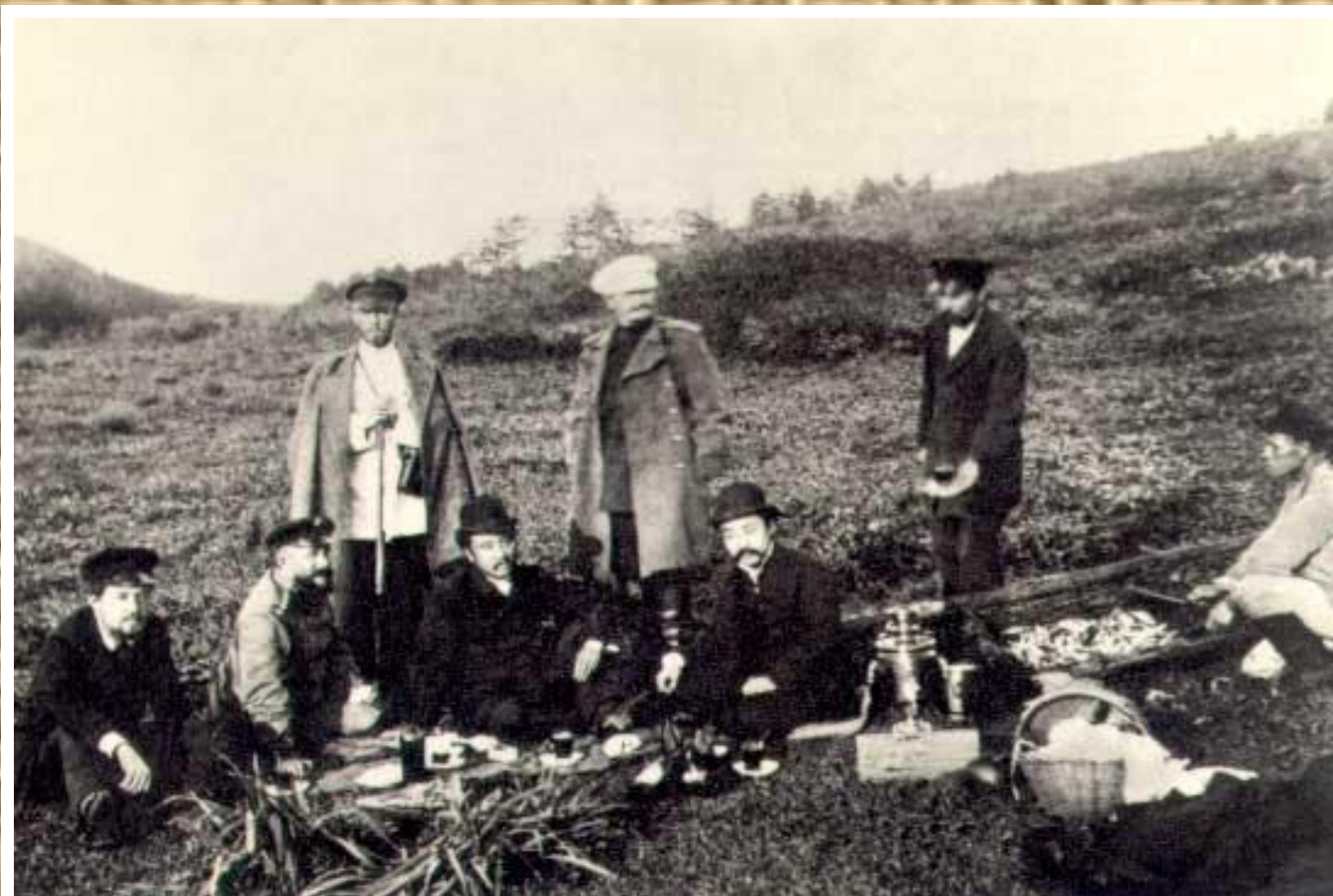
Чехов на Сахалине. 1890 г.