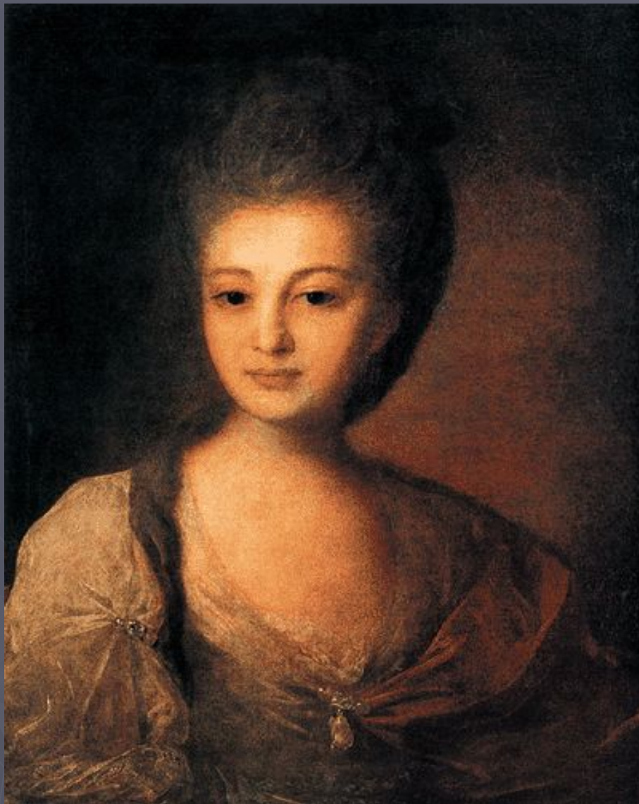
Ф. Рокотов портрет А. Струйской.