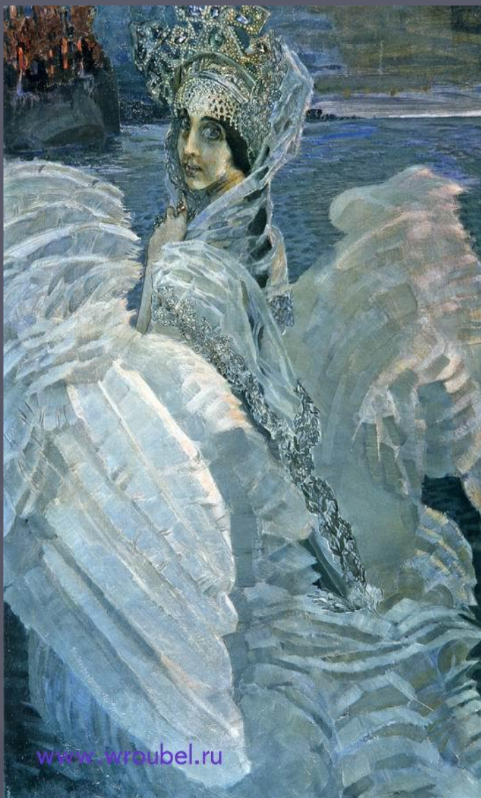
Врубель М.А. "Царевна-Лебедь."