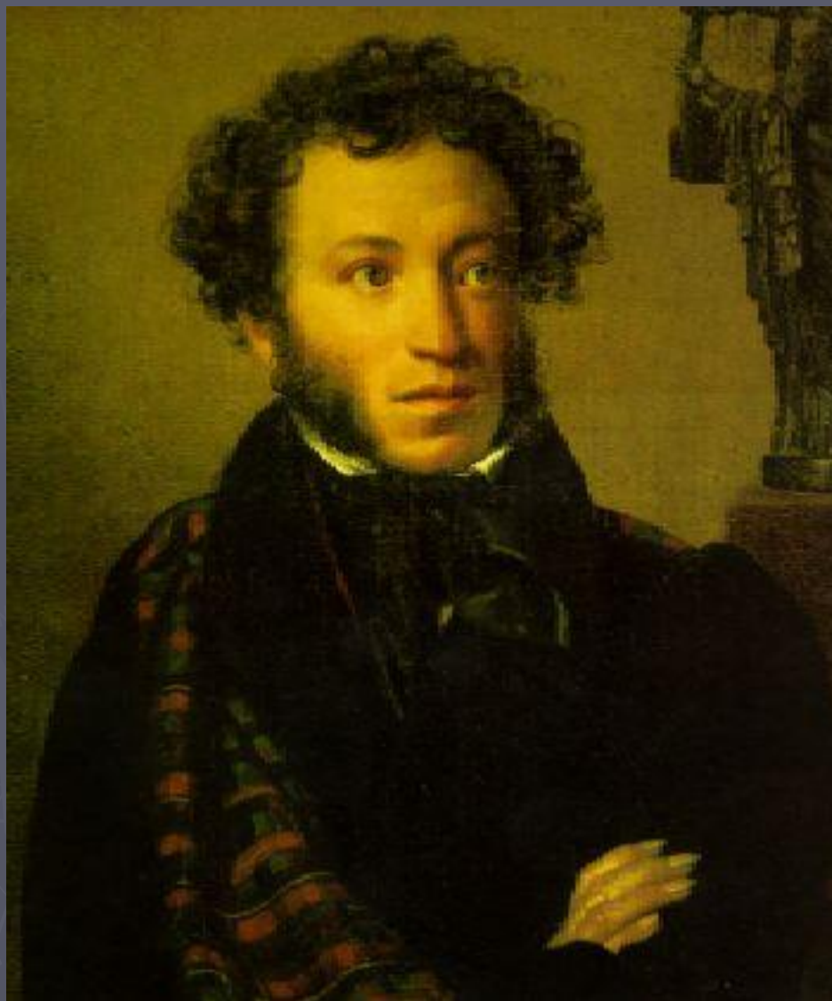
Портрет А. С. Пушкина работы О. А. Кипренского.