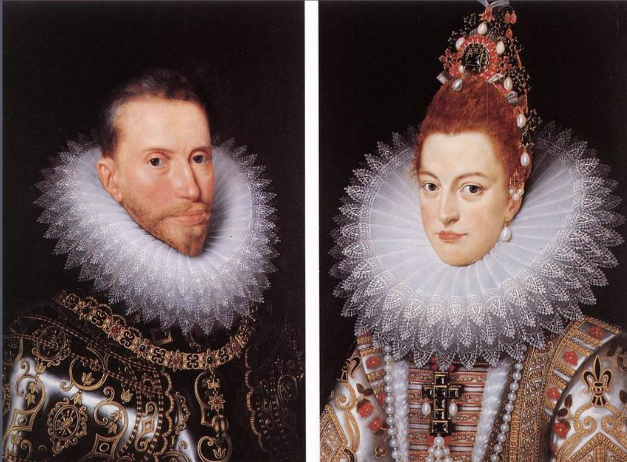
Парные портреты Изабеллы Клары Евгении и её супруга Альбрехта.