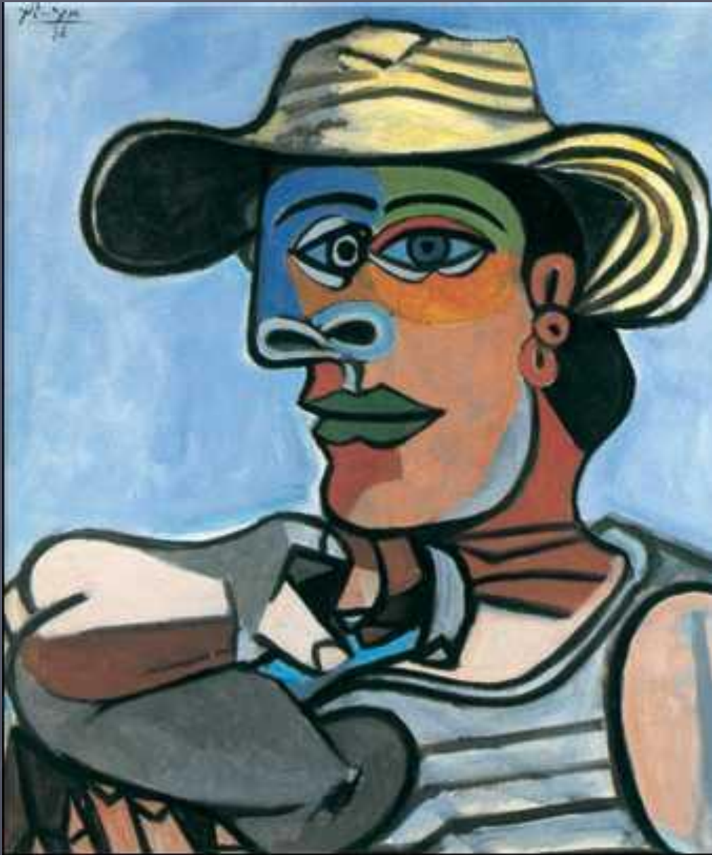
П. Пикассо. "Матрос"