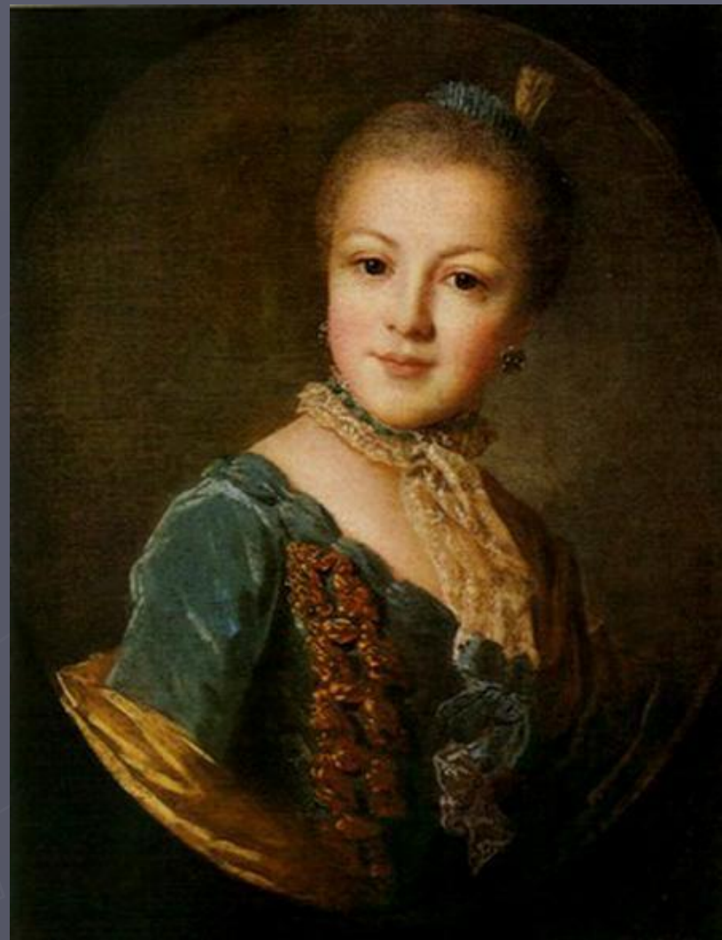
Ф.С Рокотов портрет княжны Е. Б Юсуповой