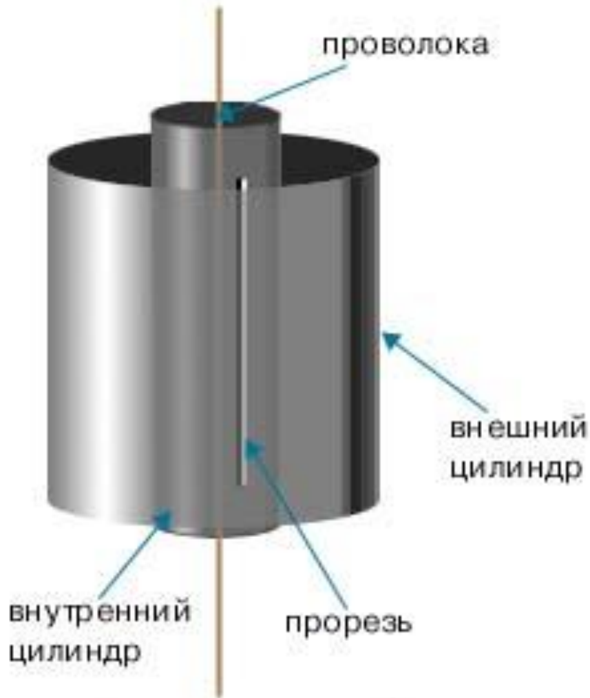
Схема установки Штерна.

Прибор Штерна состоял из двух цилиндров разных радиусов, закрепленных на одной оси. Воздух из цилиндров был откачан до глубокого вакуума. Вдоль оси натягивалась платиновая нить, покрытая тонким слоем серебра. При пропускании по нити электрического тока она нагревалась до высокой температуры, и серебро с ее поверхности испарялось. В стенке внутреннего цилиндра была сделана узкая продольная щель, через которую проникали движущиеся атомы металла, осаждаясь на внутренней поверхности внешнего цилиндра