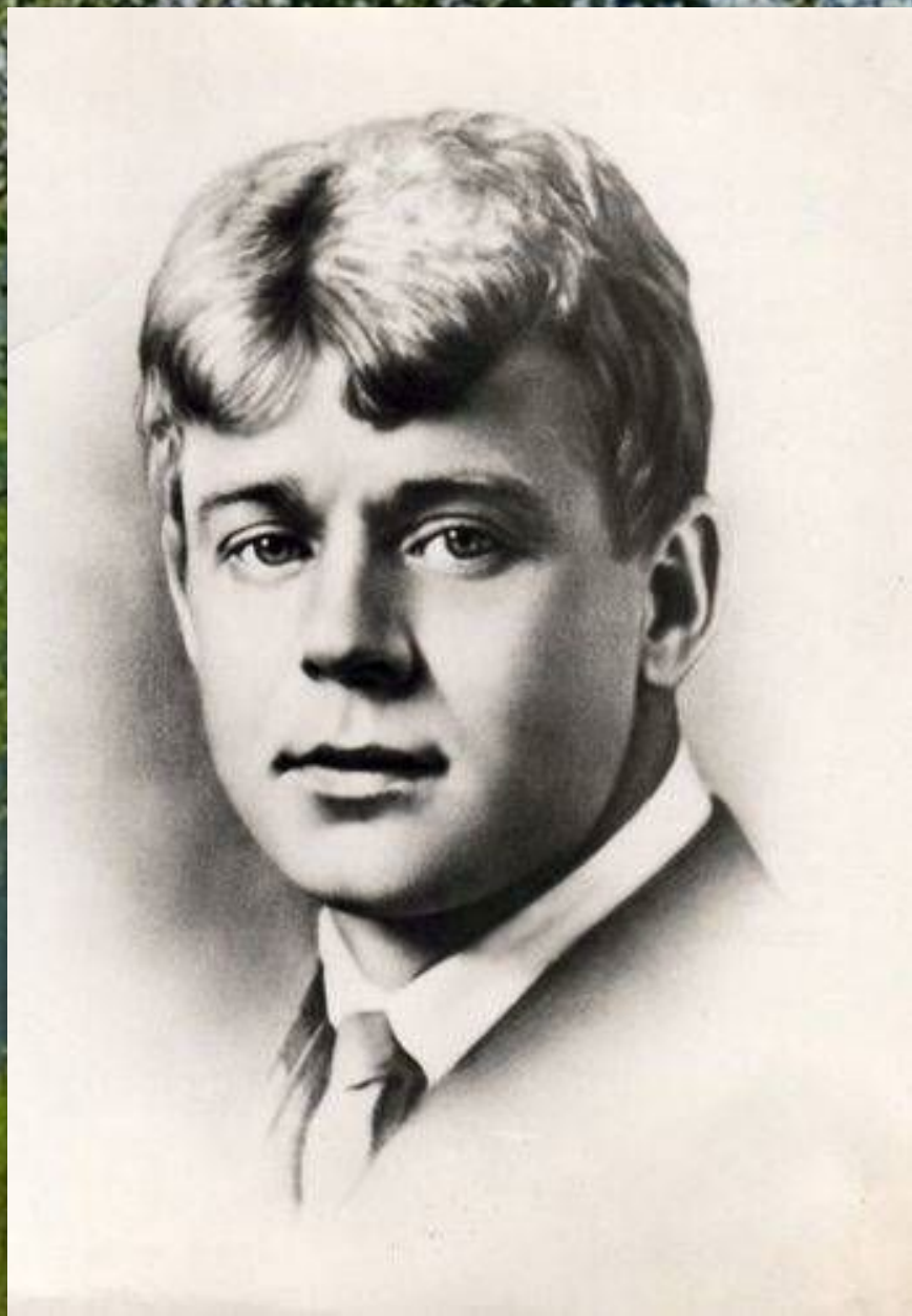
Есенин Сергей Александрович (1895 – 1925)