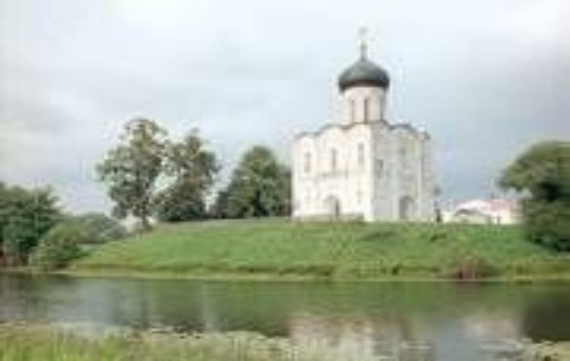
Церковь Покрова на Нерли