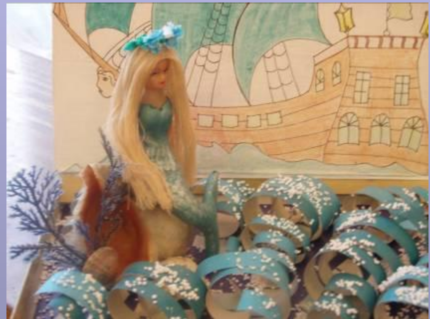
Экспонат “Музея сказок”