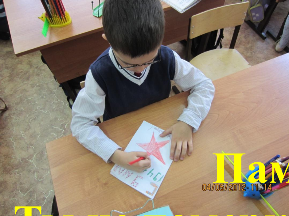
Пам'ятать! 04/05/2012 11:14