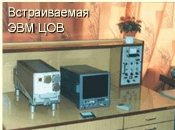
Встраиваемая ЭВМ ЦОВ