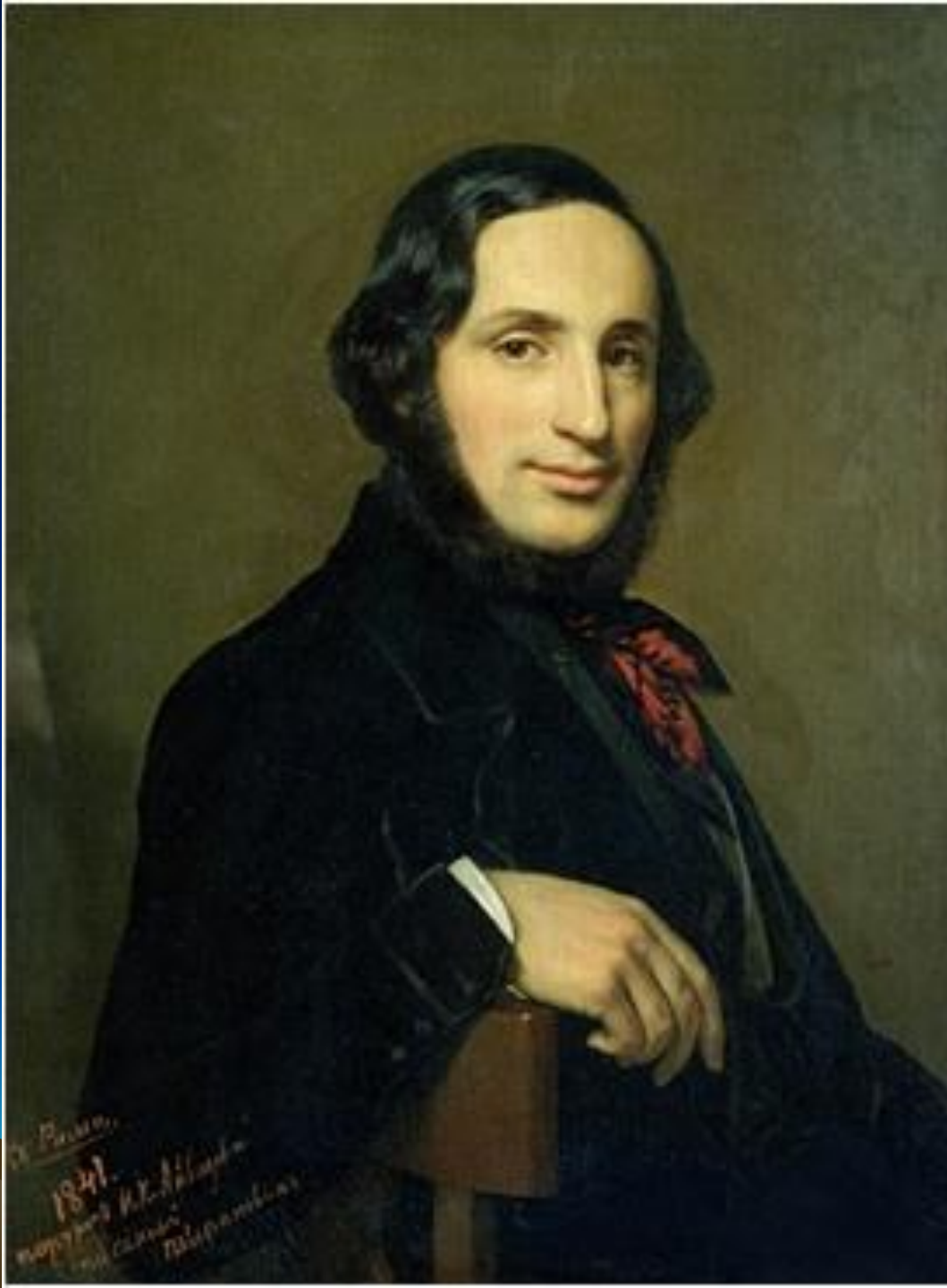
Художник-маринист И. К. Айвазовский