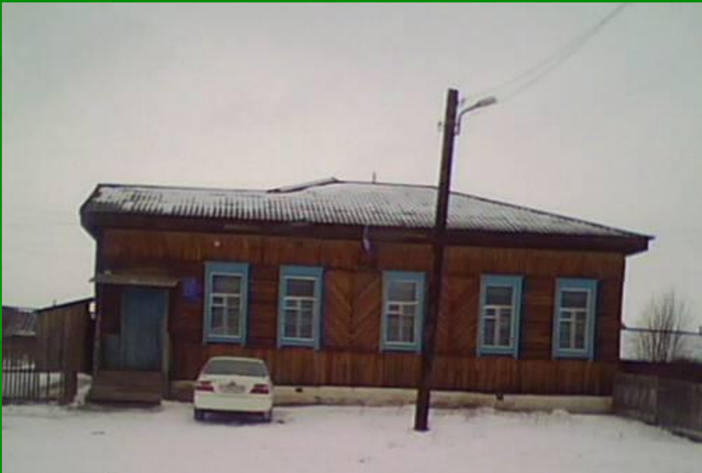
Здание Межовской сельской администрации