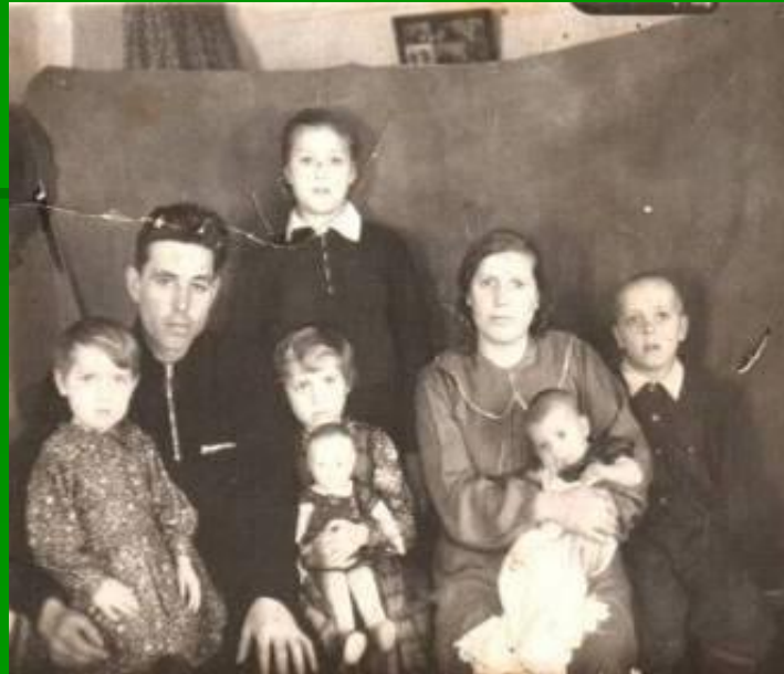
Семья Лейком – переселенцев с Поволжья

Немецкая диаспора на селе насчитывала 100 человек.