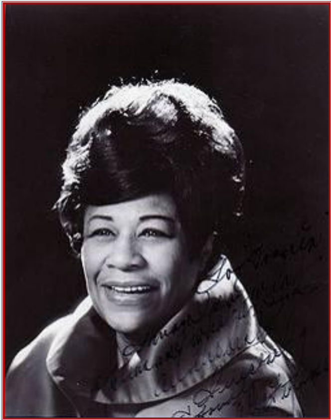
Элла Фицджералд (1917 – 1996)

Американская джазовая певица, известная также как «Леди Элла» и «Первая леди песни» . Обладательница голоса диапазоном в три октавы, Фицджералд считается одной из величайших вокалисток в истории джаза. По крайней мере, никто не мог превзойти её в мастерском владении техникой голосовой импровизации — пение скэтом .