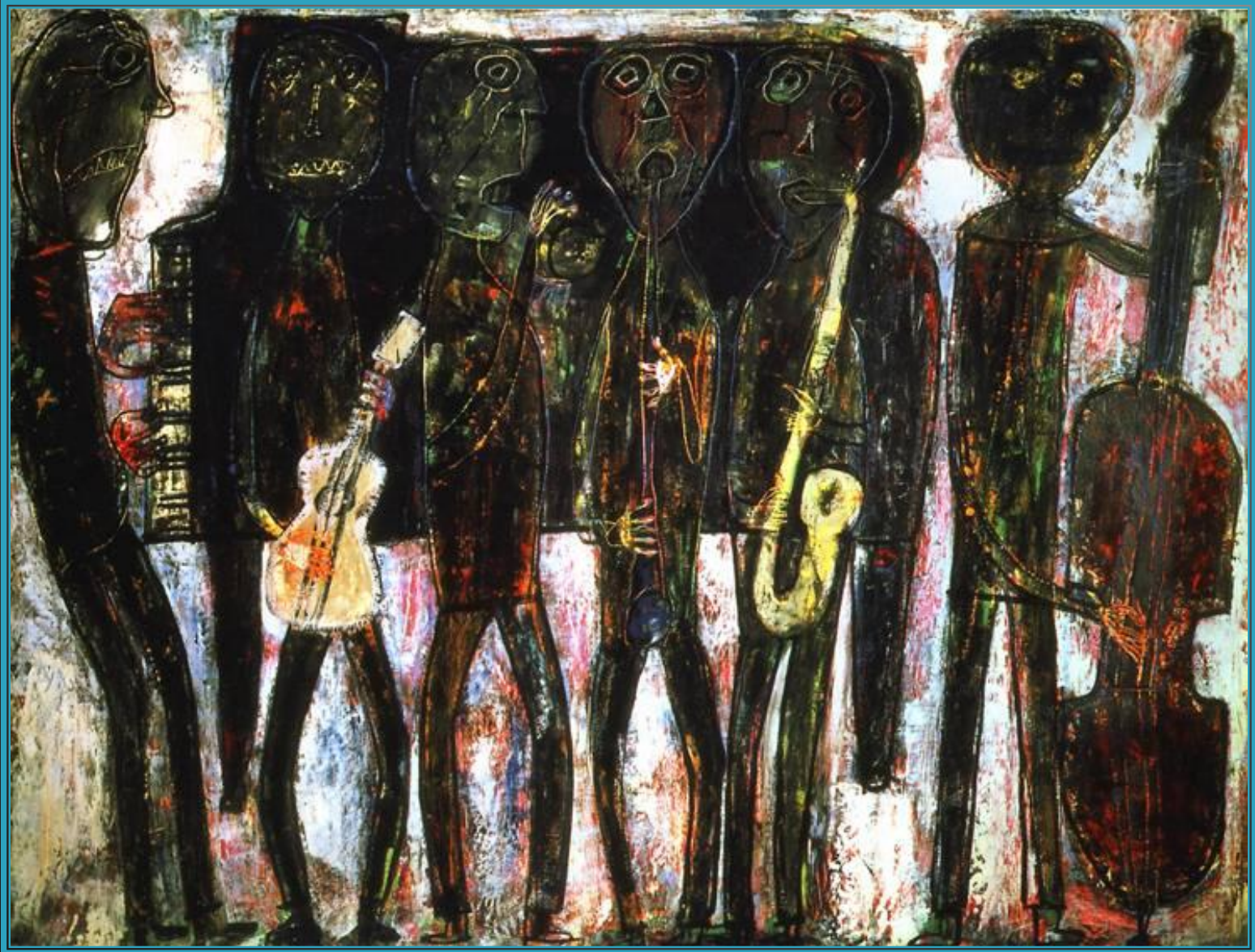
Ж. Дюбюффе «Джаз-банд» (Блюз в непристойном стиле)