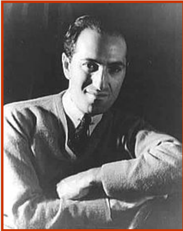
Джордж Гершвин (1898 – 1937)