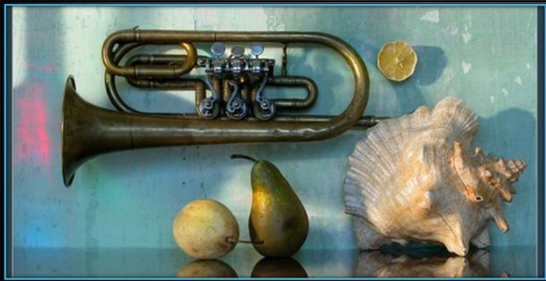
С. Белов «Утренний блюз»