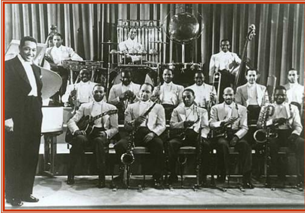
Оркестр Дюка Эллингтона