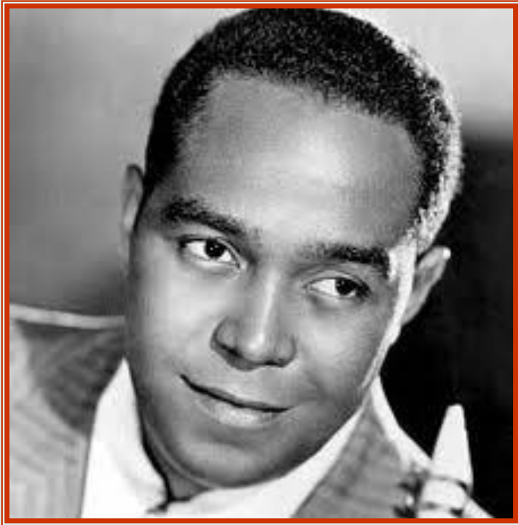
Чарли Паркер (1920 – 1955)

Альт-саксафон Чарли Паркера стал самым выразительным голосом современного джаза, в каждой своей ноте всегда идущим из глубины его измученной души.