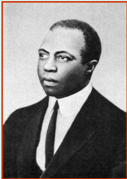
Скотт Джоуплин (1868 – 1917)