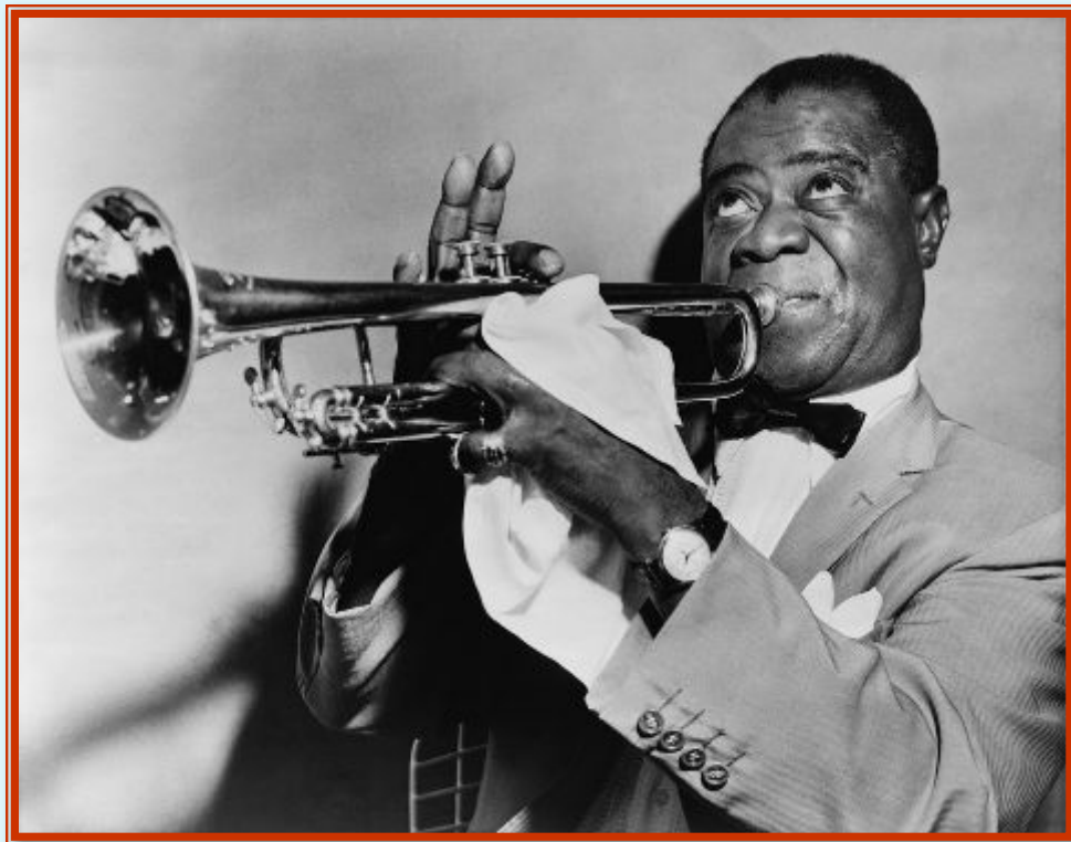
Луи Армстронг (1900 – 1971)

«Если слово «гений» и означает что-то в джазе, то оно означает – Армстронг» (Дж. Коллиер)