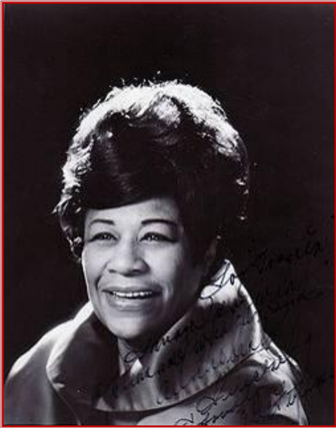
Элла Фицджералд (1917 – 1996)

Американская джазовая певица, известная также как «Леди Элла» и «Первая леди песни» . Обладательница голоса диапазоном в три октавы, Фицджералд считается одной из величайших вокалисток в истории джаза. По крайней мере, никто не мог превзойти её в мастерском владении техникой голосовой импровизации — пение скэтом .