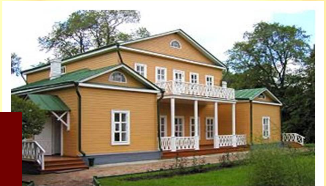
Дом-музей М.Ю. Лермонтова в Тарханах.