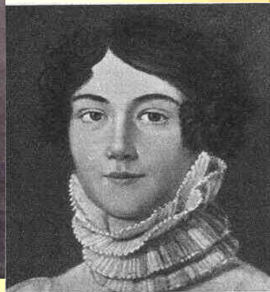
Портрет матери поэта — Марии Михайловны Лермонтовой. 7