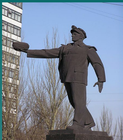
Памятник шахтерскому труду