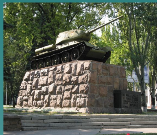
Памятник гвардии полковнику Гринкевичу