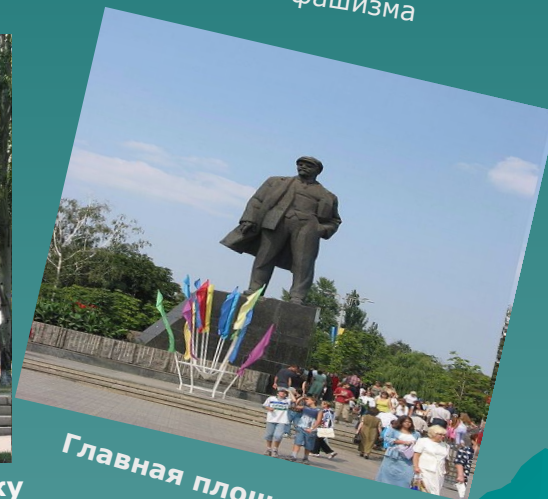
Главная площадь г. Донецка