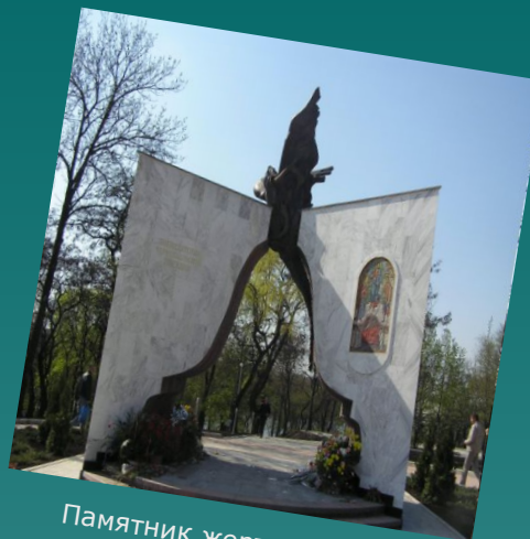
Памятник жертвам черновильской катастрофы