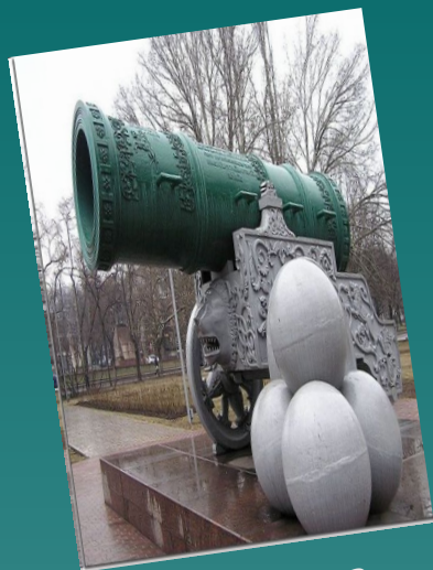
Царь - пушка