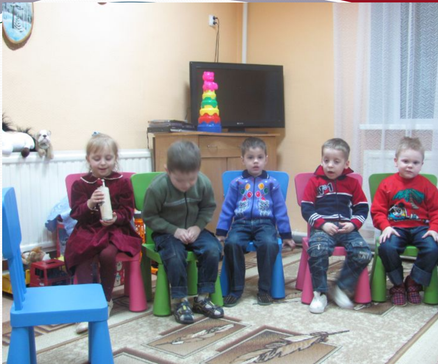
Дидактическая игра с березовой чурочкой «Доскажи словечко»