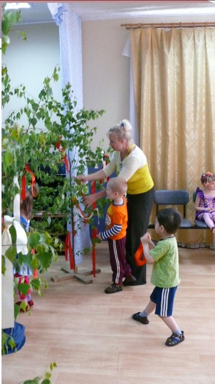
Украшение березки ленточками