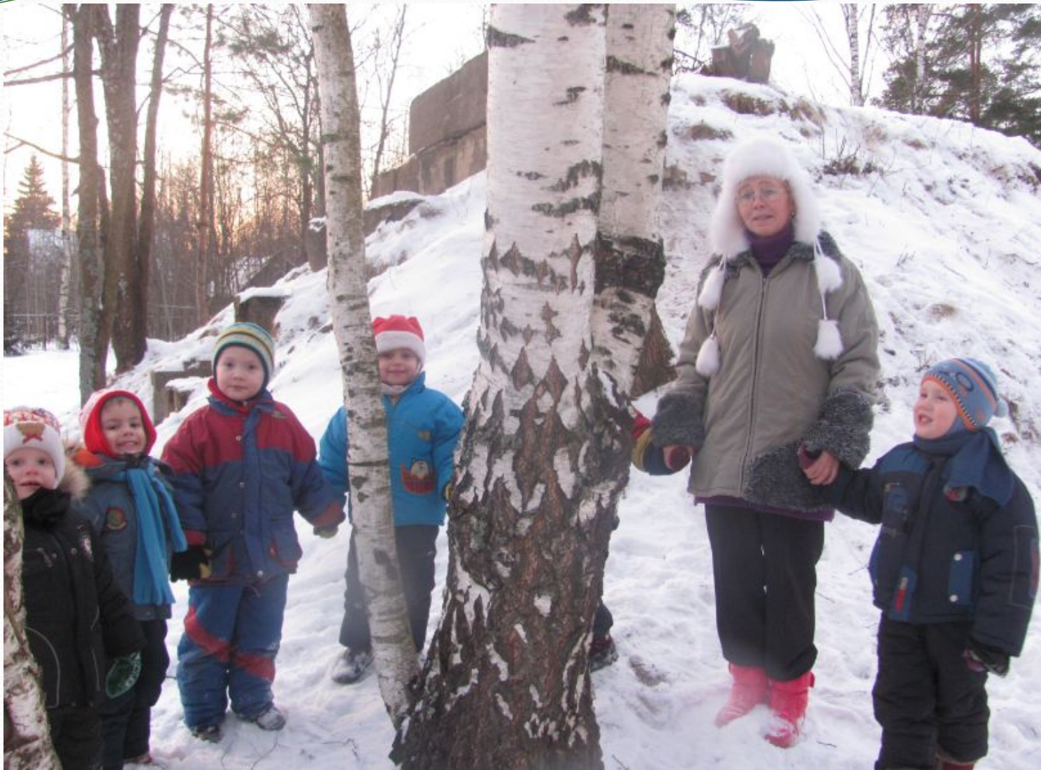
Наблюдение за березой