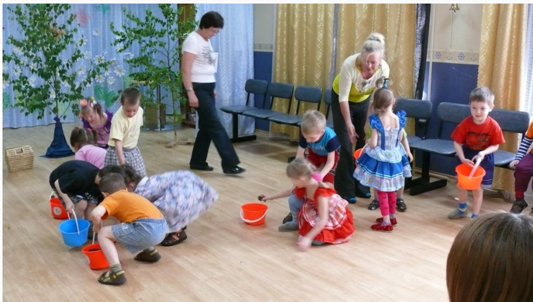
Все подберезовики собраны