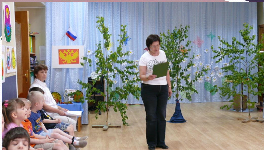
Березы – хозяйки зала