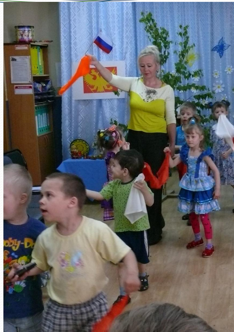
«Мы вокруг березки хороводом встали»