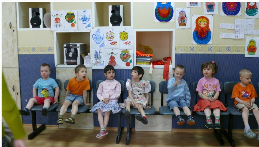
Зал украшен работами детей