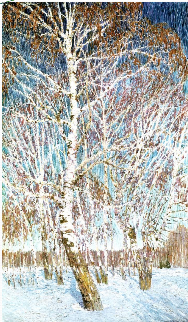
И.Э. Грабарь «Февральская лазурь»