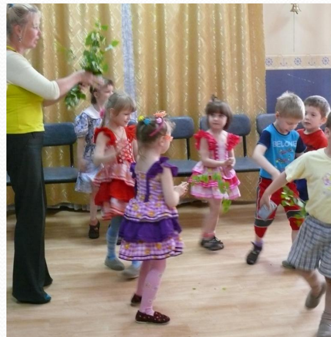
Танец с веточками