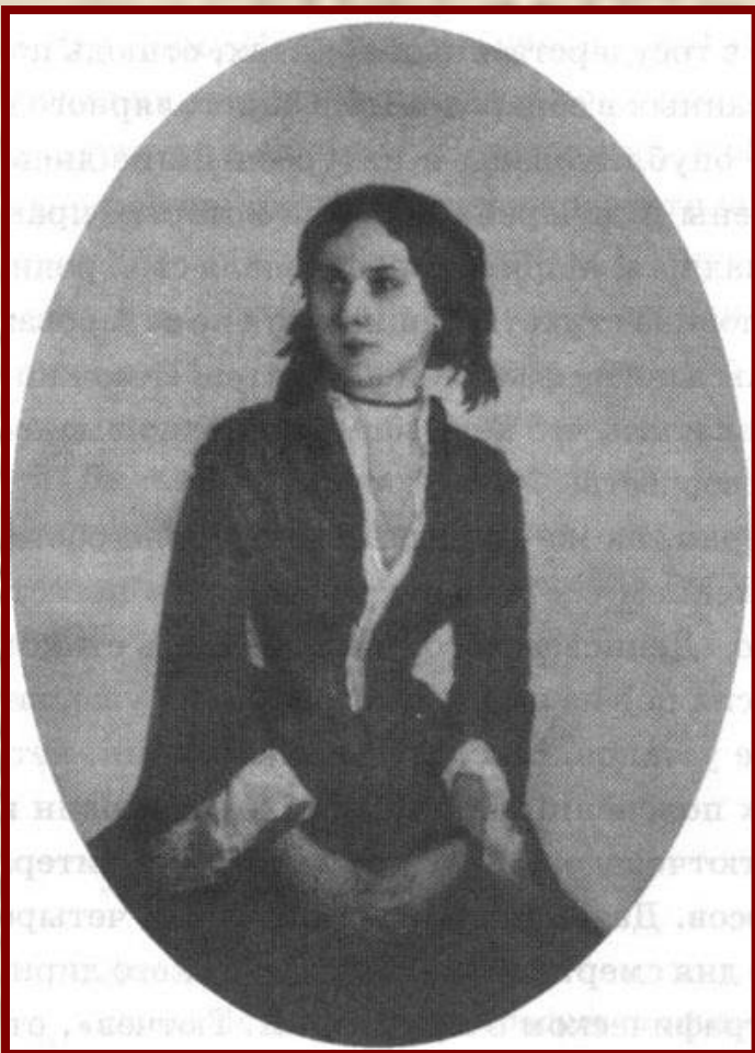
Е. А. Денисьева. Дагерротип. Начало 1850-х гг.