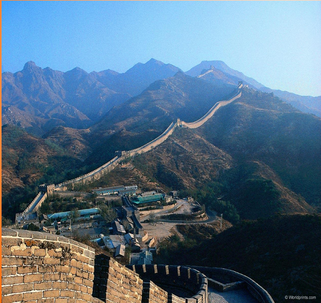
Великая Китайская стена.

Это самое длинное военное строение, да и не только военное! Продолжительность Великой Китайской стены несколько сот километров!!!