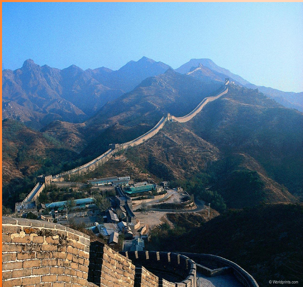
Великая Китайская стена.

Это самое длинное военное строение, да и не только военное! Продолжительность Великой Китайской стены несколько сот километров!!!