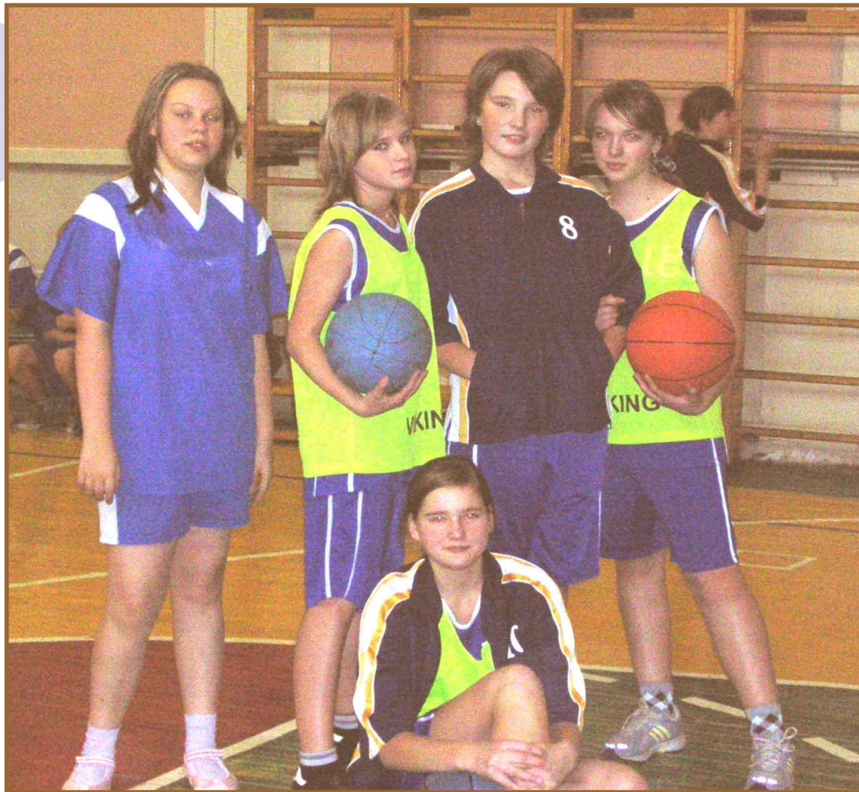
Победители районных соревнований по баскетболу