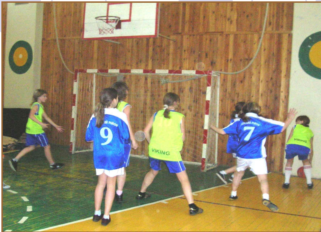
Игра с 458 школой