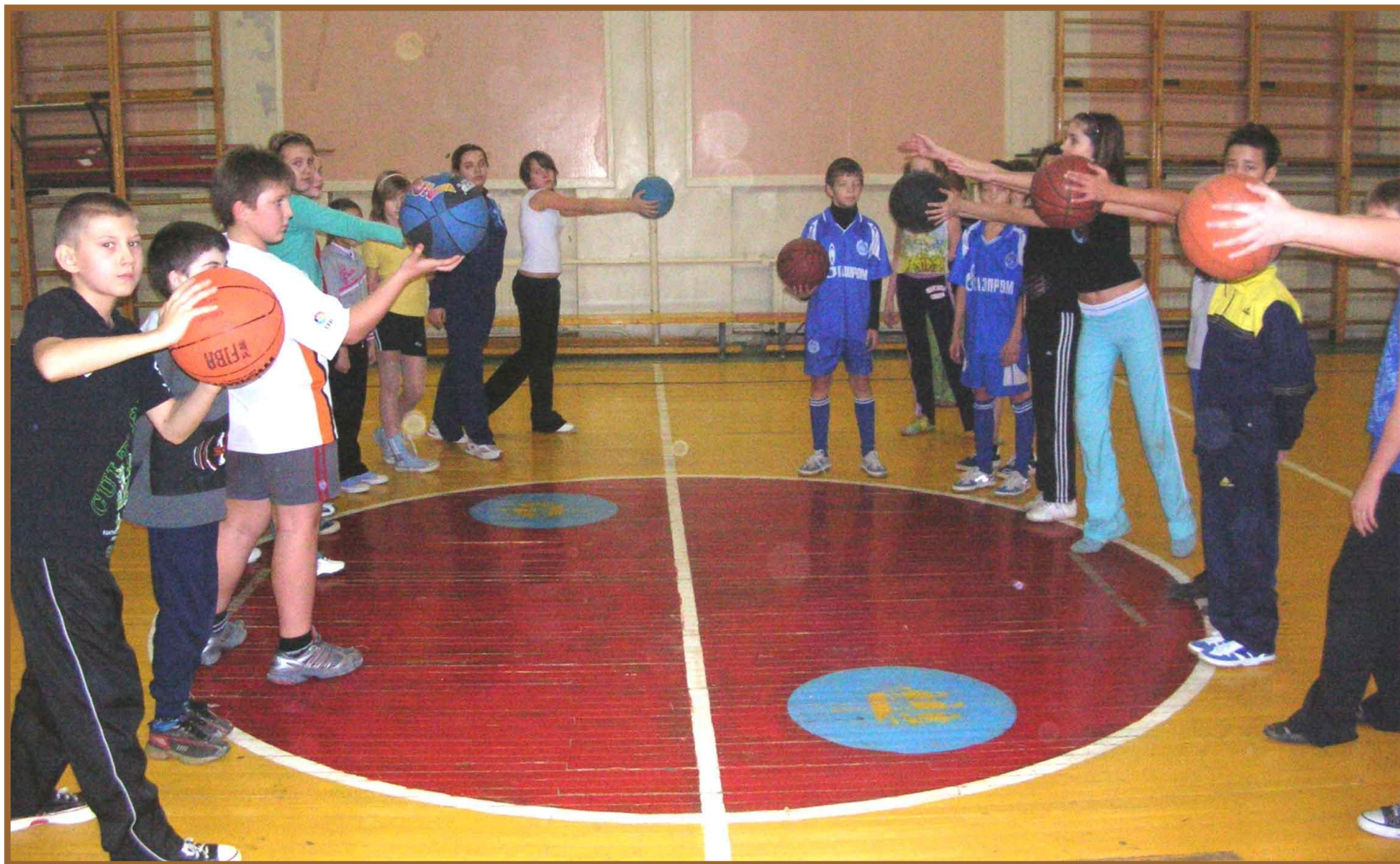
Игра «Очисти свой сад от камней»