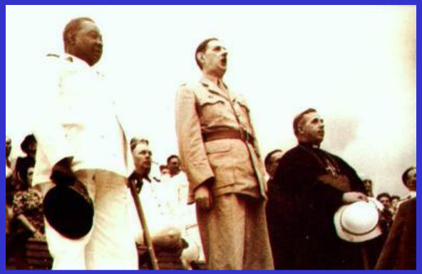
Генерал де Голль

Основные силы страны видели в Шарле де Голле сильную личность. В 1958 г. де Голль стал премьером и провел через референдум Конституцию, превращавшую Францию в президентскую республику. Последующий период вошёл в историю Франции под названием Пятой республики.