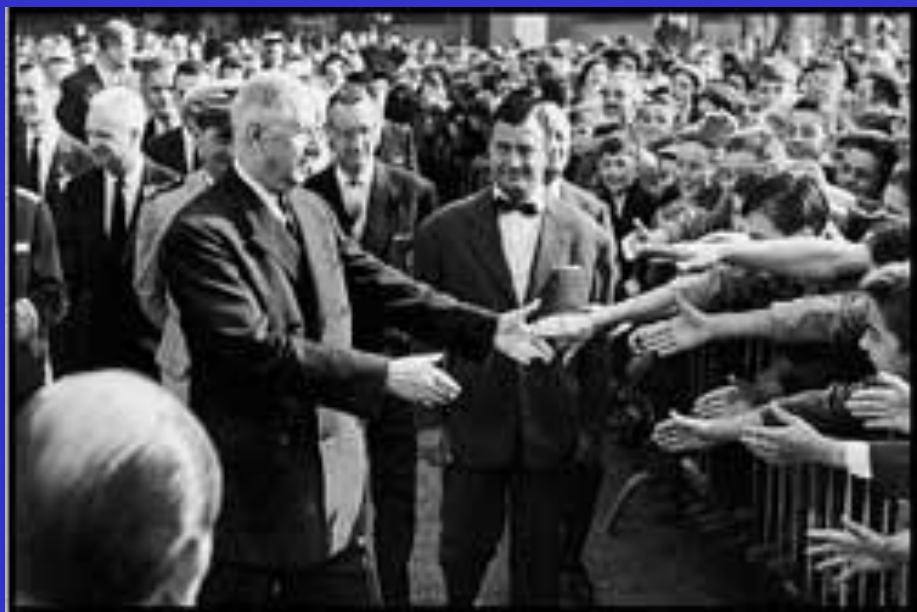
Французы приветствуют Шарля де Голля

В послевоенной Франции расставились политические силы, определявшие Французская Коммунистическая партия (ФКП), Социалистическая партия (СФИО), Католическая партия и Народно-республиканское движение (МРП). В октябре 1945 г. состоялись выборы в Учредительное собрание, победу на которых одержали левые силы, которые активно участвовали в Движении Сопротивления. Во главе сформировавшегося правительства стал Шарль де Голль. В 1946 г. была принята новая Конституция, которая знаменовала собой установление во Франции Четвёртой республики.