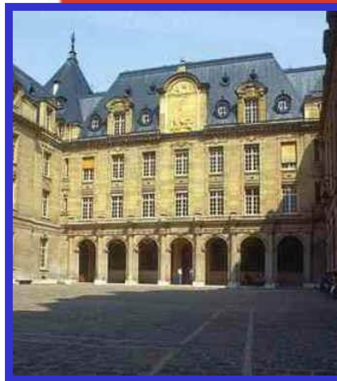
Сорбонский университет. Париж.

Но постепенно в стране начало нарастать недовольство авторитарным стилем руководства, характерным для Ш. Де Голля.