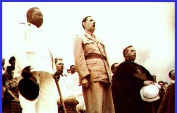
Генерал де Голль

Основные силы страны видели в Шарле де Голле сильную личность. В 1958 г. де Голль стал премьером и провел через референдум Конституцию, превращавшую Францию в президентскую республику. Последующий период вошёл в историю Франции под названием Пятой республики.