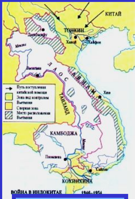
Война в Индокитае