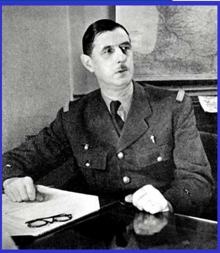
Шарль де Голль

После окончания Второй мировой войны Франция утратила положение вели-