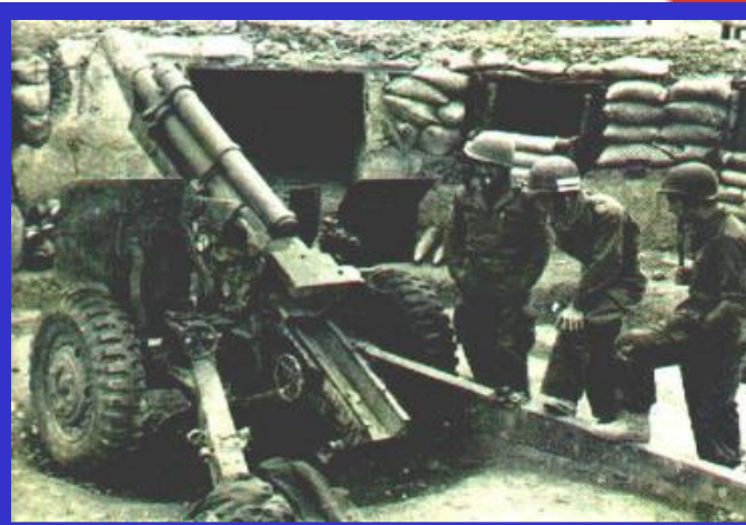
Французские солдаты в Индокитае

Согласно конституции французская колониальная империя преобразовалась во Французский Союз, в который включались и государства, вставшие уже на путь независимости. Среди них были Вьетнам, Камбоджа, Лаос. Но коммунистическое правительство Вьетнама отказалось признать это решение, что привело к войне Франции против Демократической Республики Вьетнам (1946-1954 гг.).