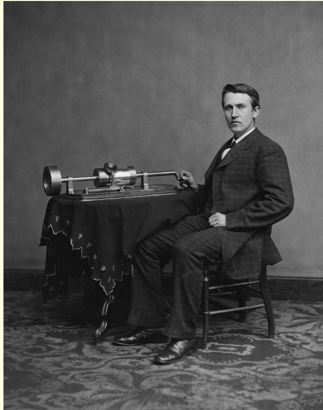
Томас Алва Эдисон (1847 – 1931)