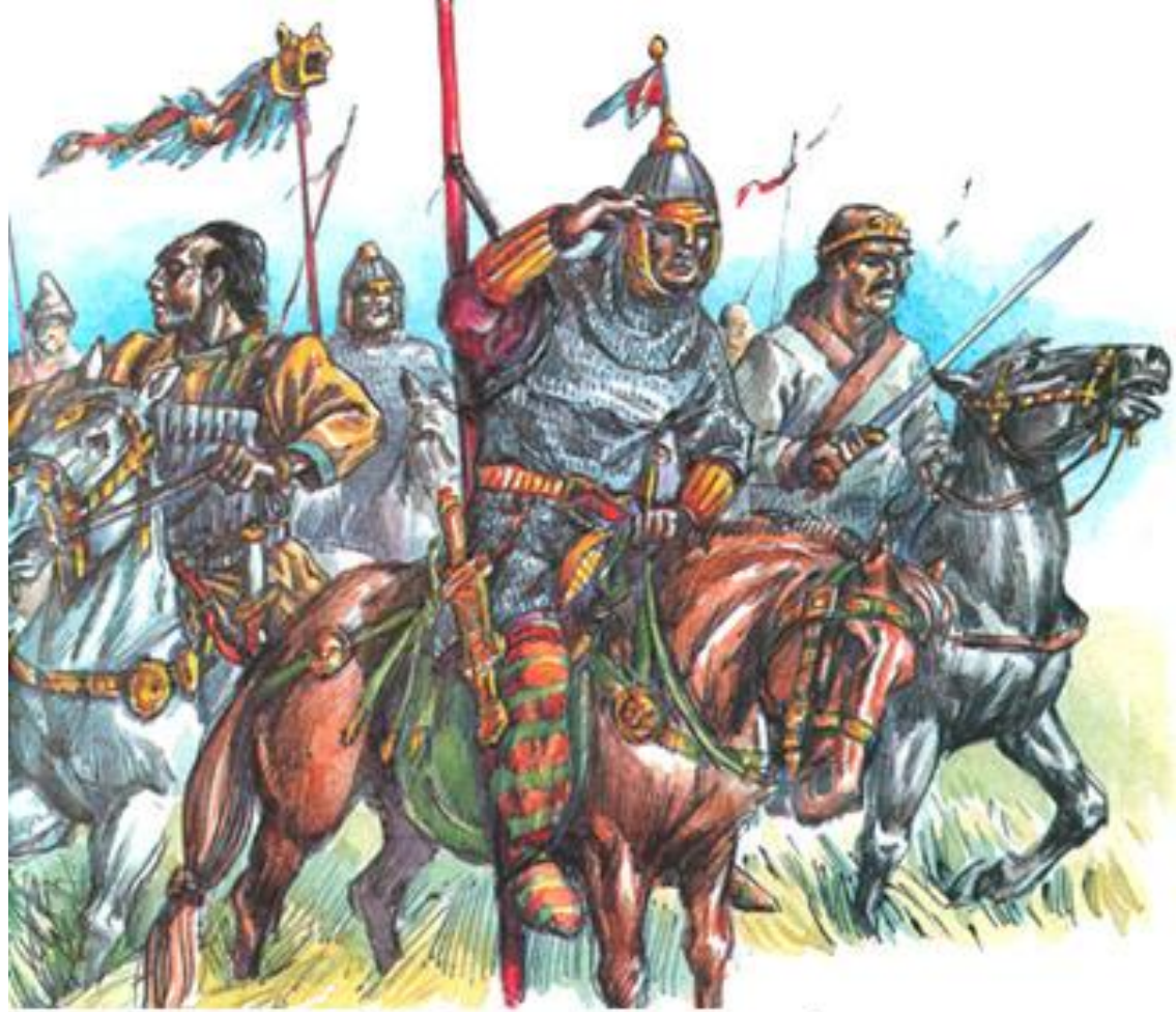
М. Горелик. "Поток гуннов"

Степи и пустыни Северного и Западного Китая в древности и Средние века были населены непокорными кочевниками – гуннами. Они вторгались в деревни, уводили пленных и скот. Иногда им удавалось даже дойти до столицы Китая.