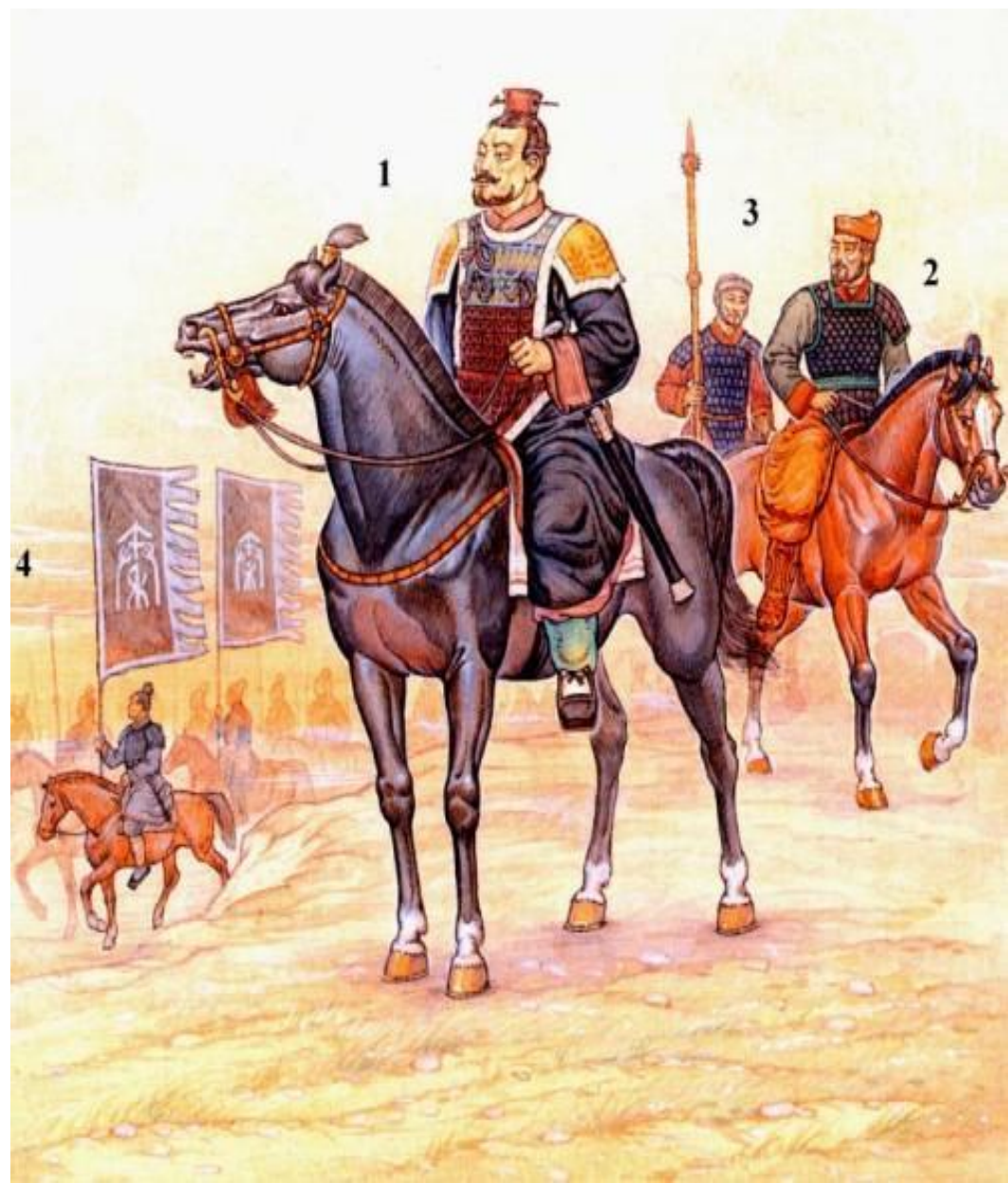
Китайский император Цинь Ши-хуанди с воинами.

Цинь Ши-хуанди славился своей любовью к огромным сооружениям и задумал соорудить стену, которая бы защищала северо-западные границы Китая.