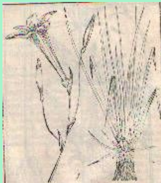
красноднев малый из семейства лилейных

гнездоцветка клубочковая из семейства орхидных