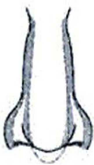
Короткий і широкий