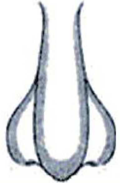
Великий і круглий