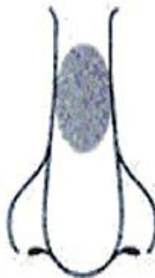
Горбинка на носі