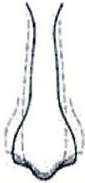
Вузький і довгий