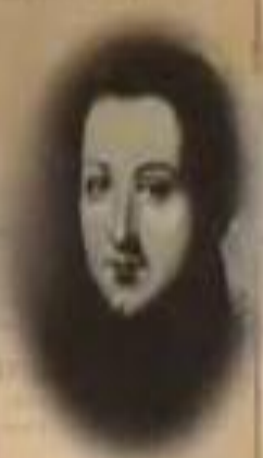
МИХАИЛ БЕСТУЖЕВ- РЮМИН