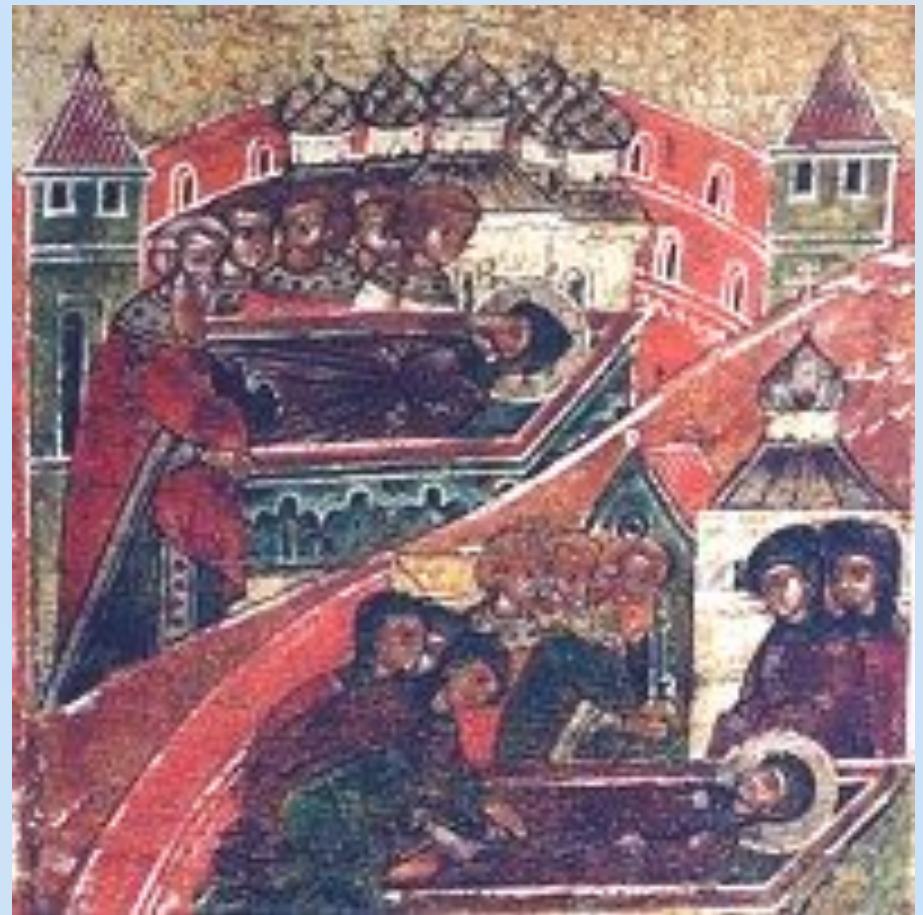
Разнесение тел Петра и Февронии по отдельным гробам.