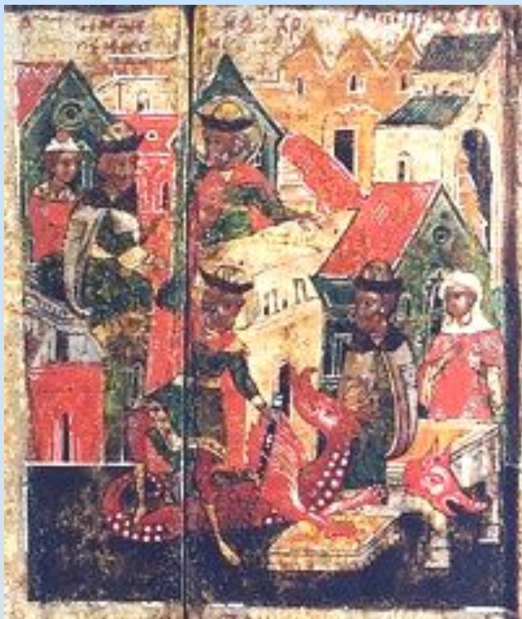
Князь Петр убивает змея.

Князь Петр на одре болезни. Предстоящие рассказывают ему о Рязанской земле, славящейся своими врачами.