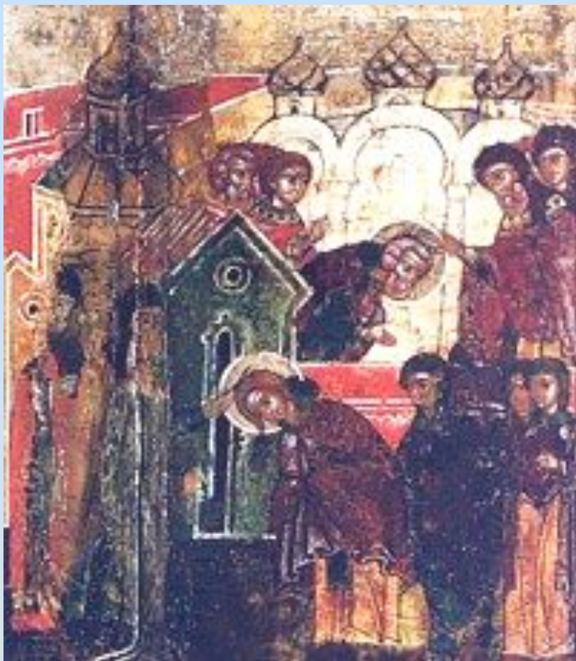
Иноческий постриг Петра и Февронии.

Петр посылает сказать Февронии, вышивающей воздух, что умирает. Она просит его подождать, пока не закончит работу.