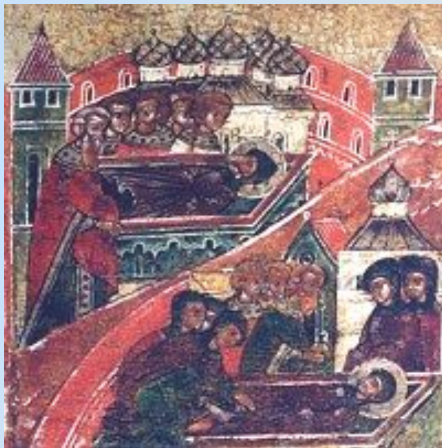
Разнесение тел Петра и Февронии по отдельным гробам.