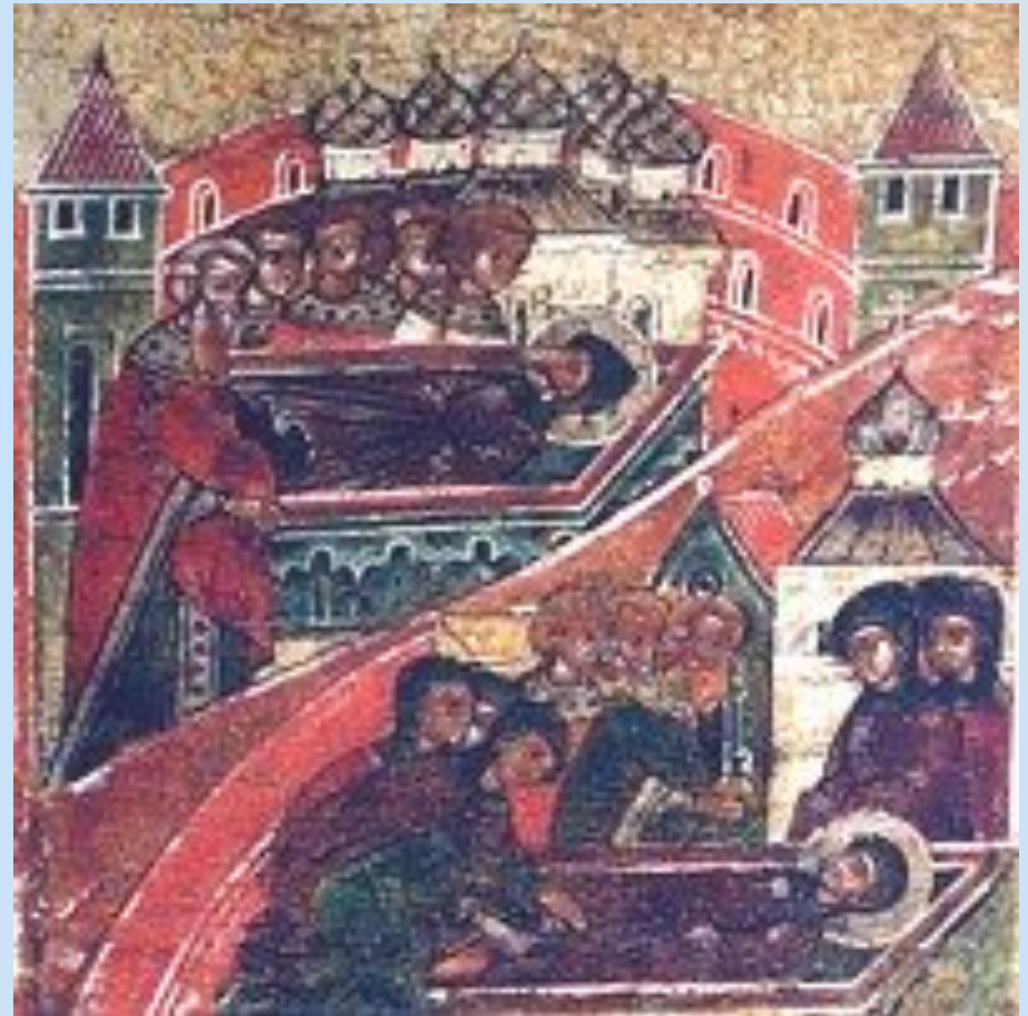
Разнесение тел Петра и Февронии по отдельным гробам.