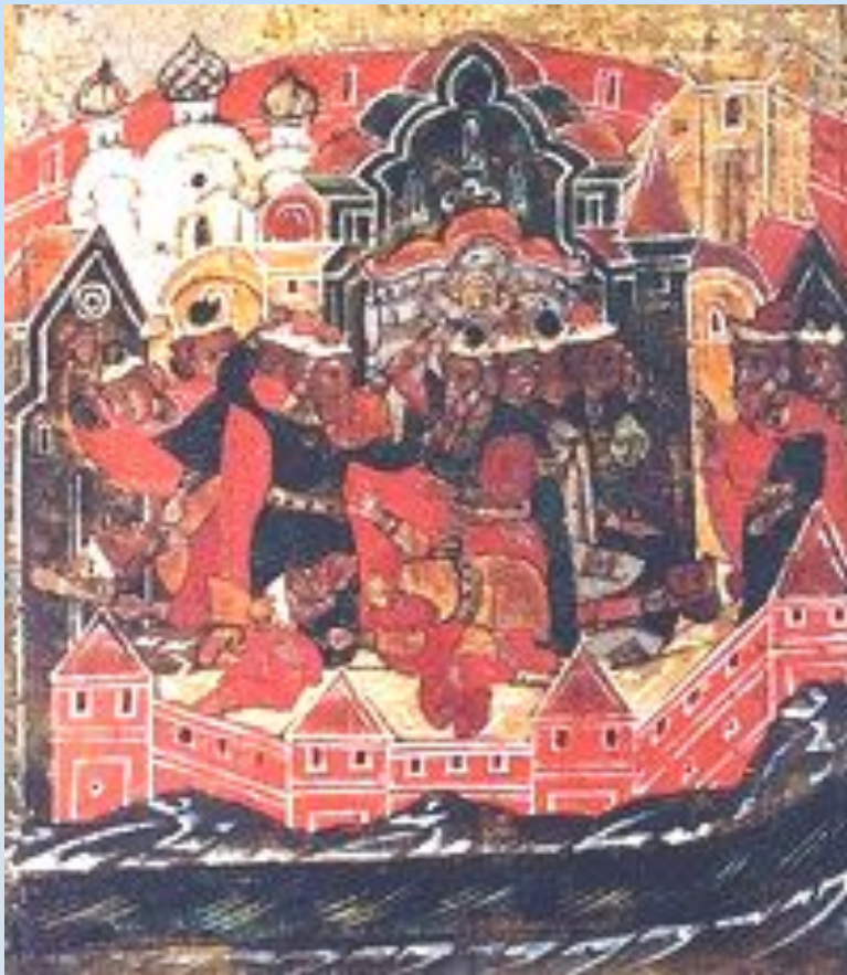
Междоусобица в Муроме.

Бояре призывают Петра и Февронию вернуться на княжение.