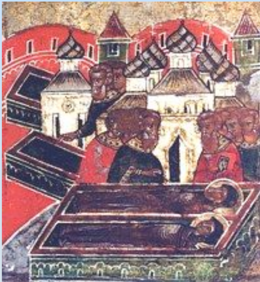
Обретение тел Петра и Февронии в едином гробе.