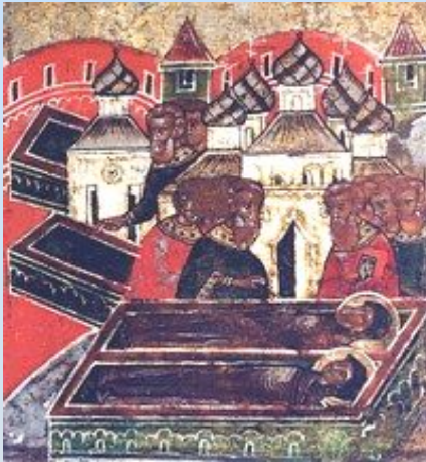
Обретение тел Петра и Февронии в едином гробе.