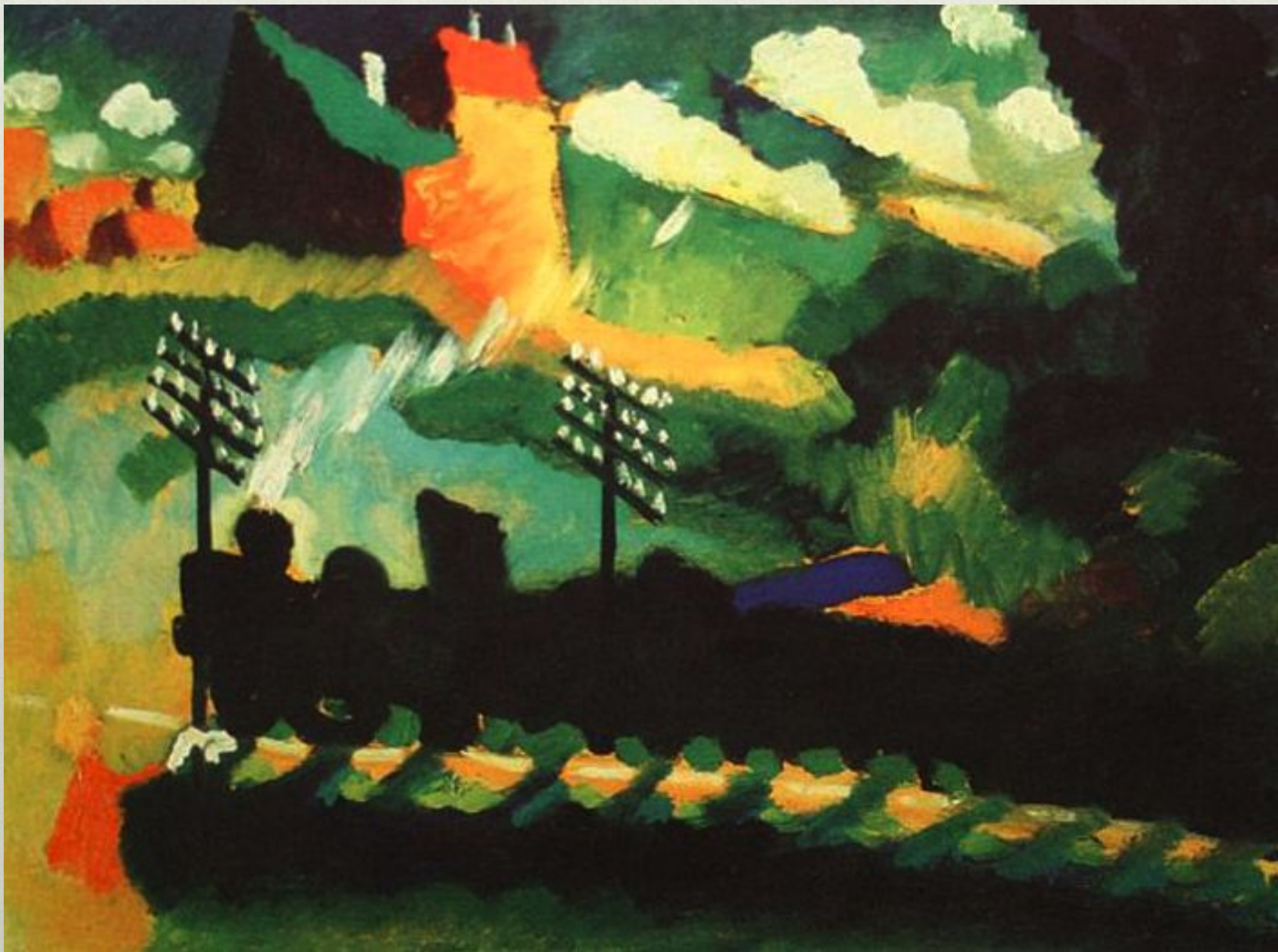
В.Кандинский. Поезд в Мурнау. 1909 г.