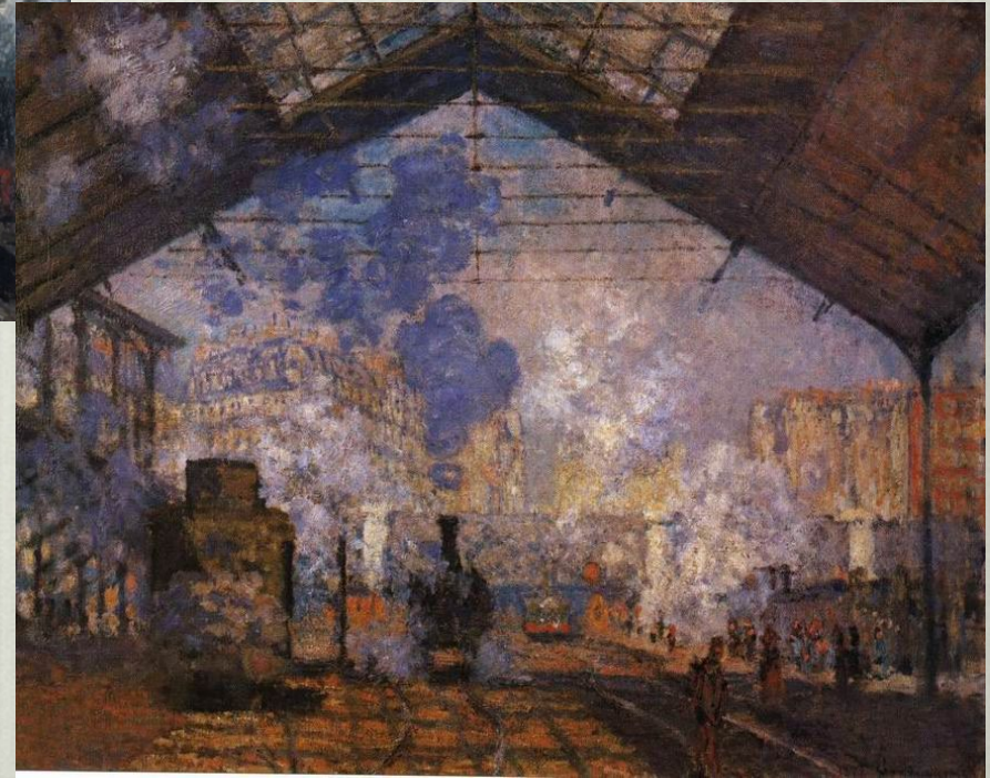
К.Моне. Вокзал Сент-Лазар в Париже. 1877 г.