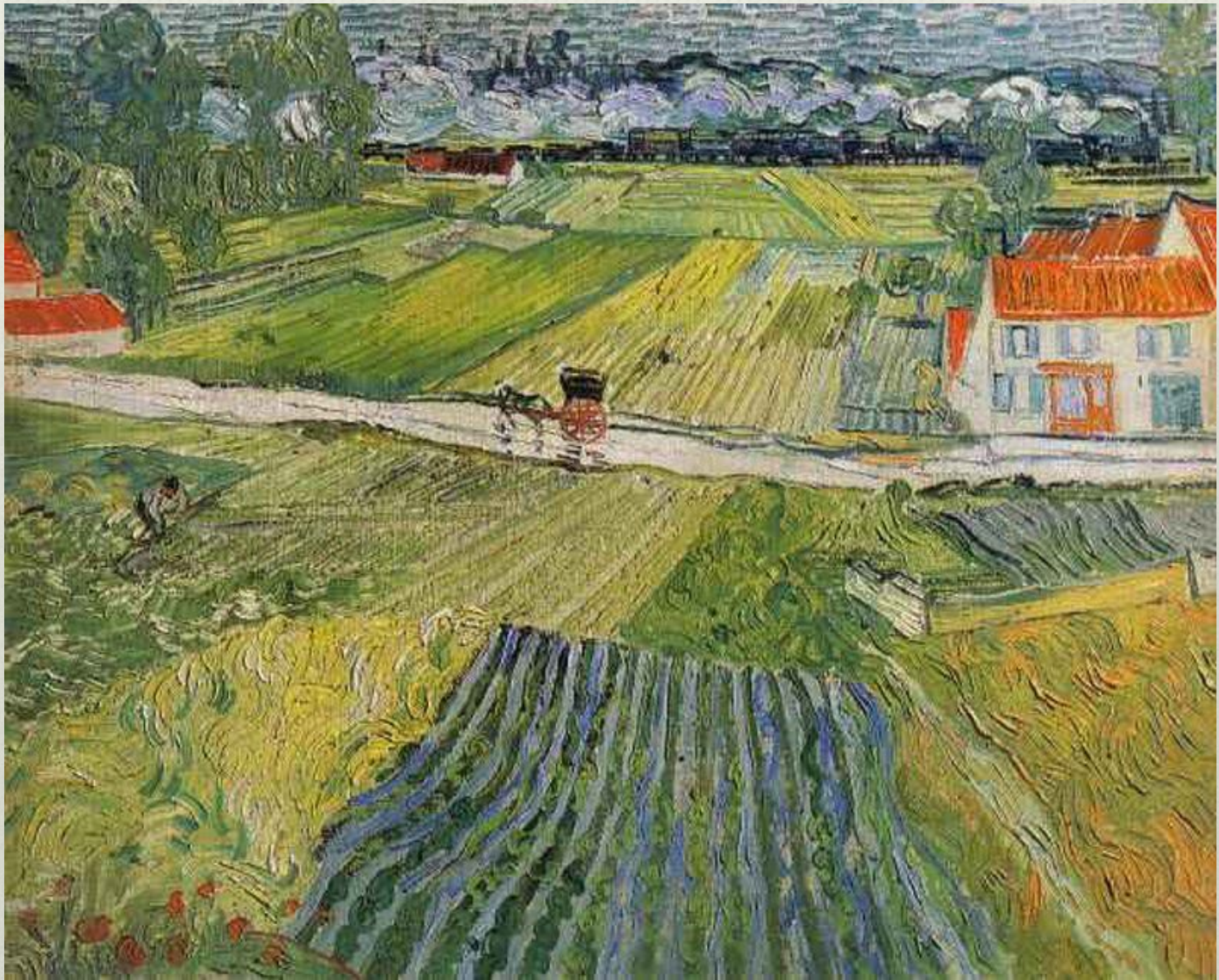
В. ван Гог. Пейзаж с тележкой и поездом. 1890