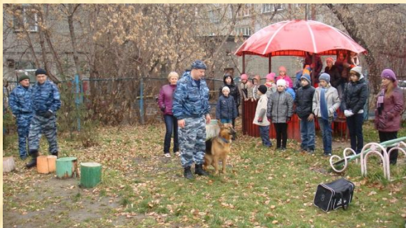
ОДН ЛО МВД России на ст. Новосибирск с совместно с Кинологами