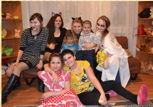
Студенты Новосибирского Государственного Университета Экономики и Управления