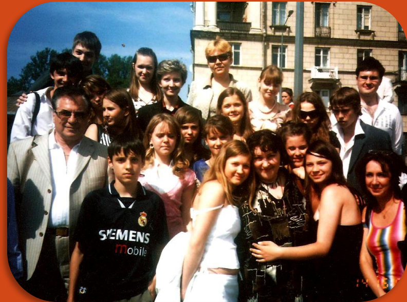
Выпуск 2007 – 9 класс