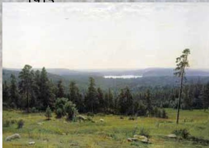
Иван Шишкин Лесные дали