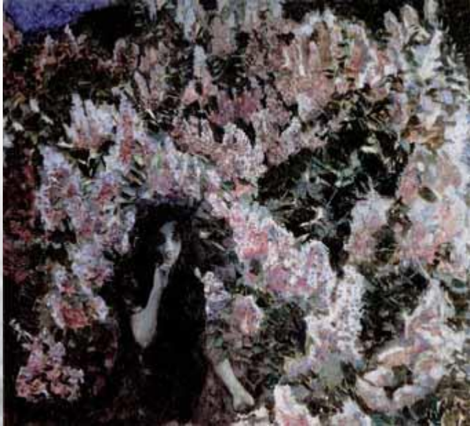
Михаил Врубель Сирень. 1900

Благодаря произведениям искусства — литературным, музыкальным, живописным — природа предстает перед читателями, слушателями, зрителями всегда разной: величественной, грустной, нежной, ликующей, скорбящей, трогательной.