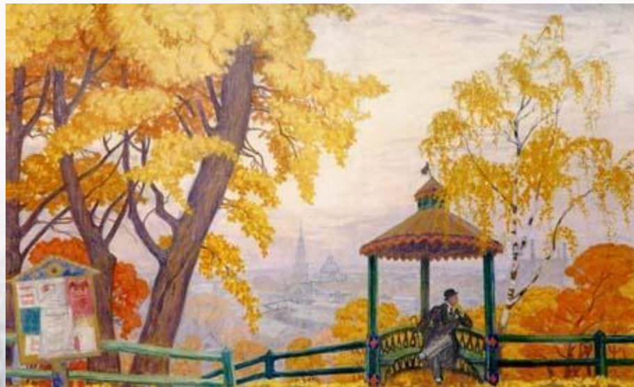
Борис Кустодиев. Осень. 1915

Во все времена живописцы, композиторы и писатели воплощают в своих произведениях различные явления природы, волновавшие их.