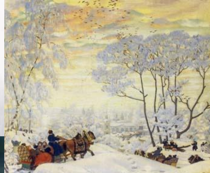
Борис Кустодиев Зима. 1916