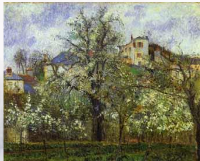
Камиль Писсаро Фруктовый сад в Понтуазе