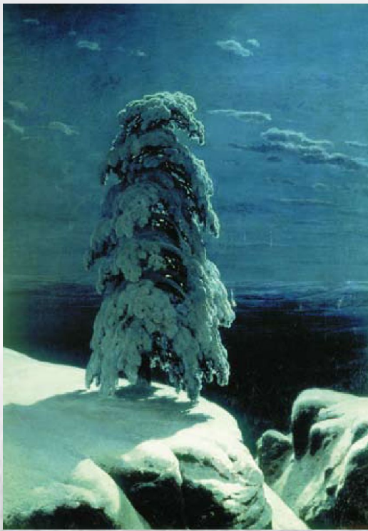
Иван Шишкин На севере диком

А. Пушкин называл искусство «магическим кристаллом» , сквозь грани которого по-новому видны окружающие нас люди, предметы и явления привычной жизни.