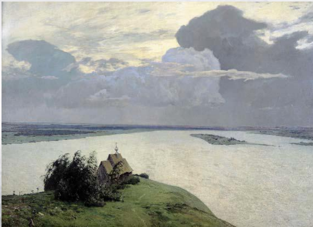
И. Левитан. Над вечным покоем.

Отчего простой русский пейзаж, отчего прогулка летом в России, в деревне, по полям, по лесу, вечером в степи, бывало, приводили меня в такое состояние, что я ложился на землю в каком-то изнеможении от наплыва любви к природе, тех неизъяснимо сладких и опьяняющих впечатлений, которые навевали на меня лес, степь, речка, деревня вдали, скромная церквушка, словом, всё, что составляло убогий русский родимый пейзаж? Отчего все это?