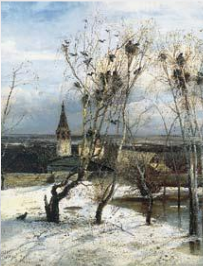
А. Саврасов. Грачи прилетели.

Русские художники XIX в. А. Саврасов, И. Левитан, И. Шишкин и другие открыли красоту родной земли.