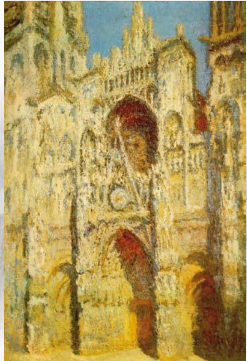
К. Моне. Реймский собор на восходе солнца

В XX в. в зарубежном изобразительном искусстве возникло направление, которое получило название «импрессионизм» (от франц. impression — впечатление). Художники-импрессионисты старались зафиксировать в своих картинах мимолетные впечатления от реально существующего мира.