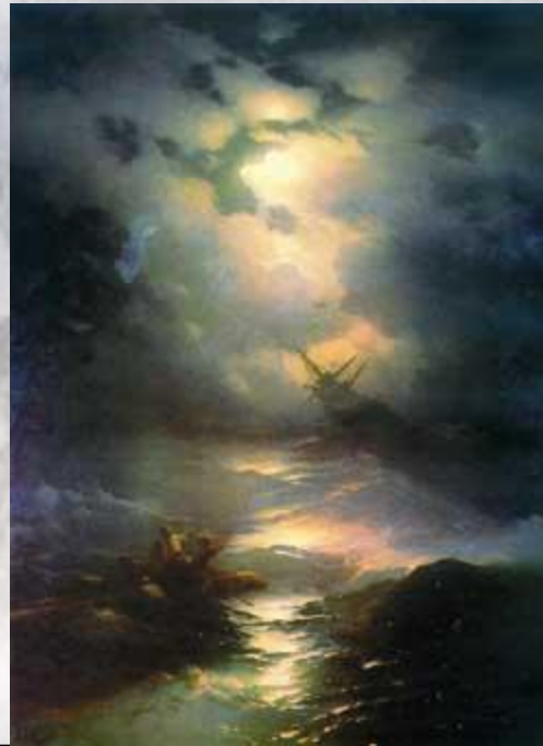
Иван Айвазовский Буря на Северном море. 1865