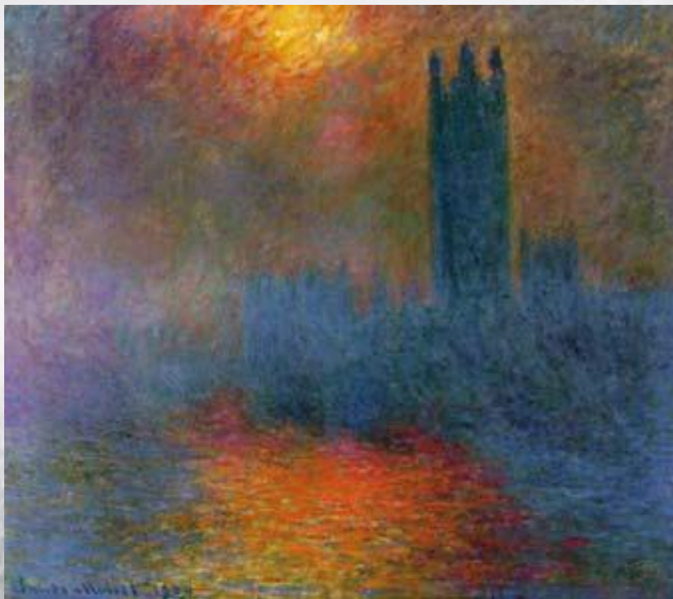
К. Моне. Вестминстерское аббатство