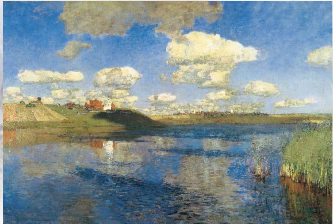
И. Левитан. Озеро. Русь