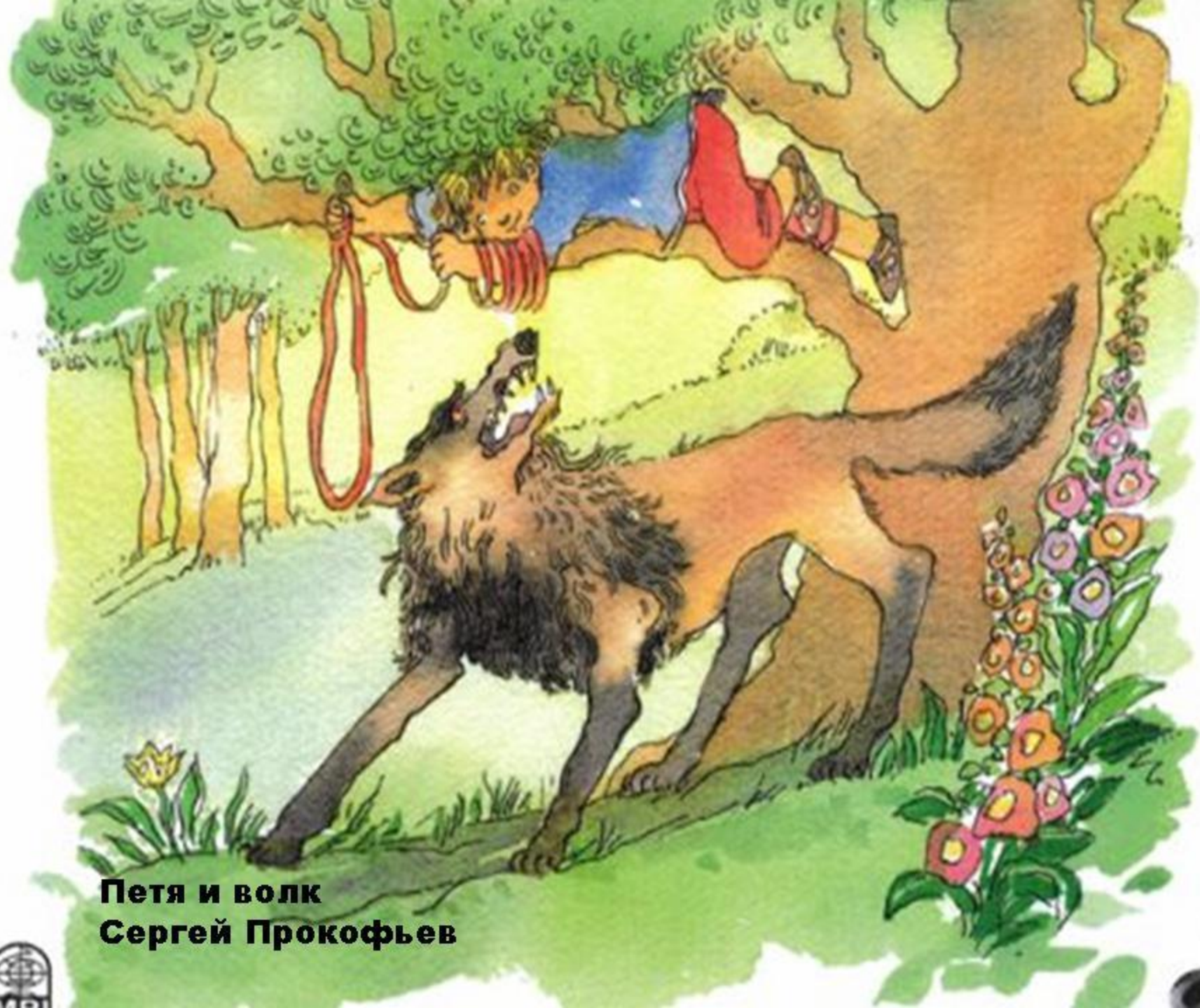
Петя и волк Сергей Прокофьев