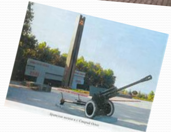
Артиллерийский памятник в г. Старый Оскол