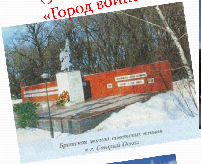
Братская могила советских воинов в г. Старый Оскол