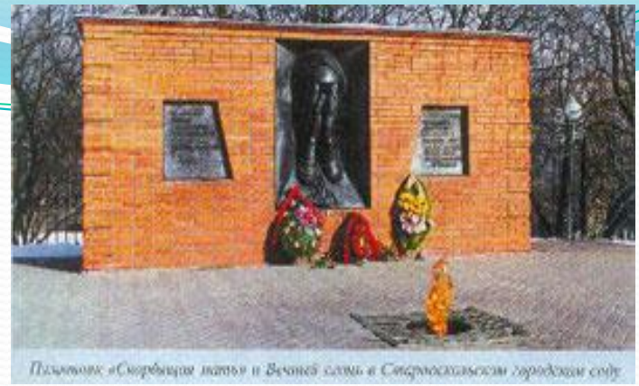
Памятник «Скорбящая мать» в Великой славы в Старооскольском городском саду.

Он в сердце – всегда на виду... (5 мая 2011 г. Городу присвоено звание «Город воинской славы»)