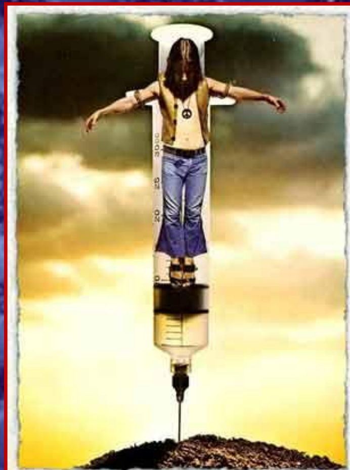
1971 г. "Современное распятие". Из ж-ла Mad, сент. 1971. www.collectmad.com/madcoversite/crucifixion.html