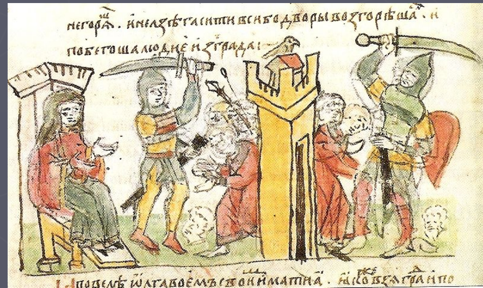
Сожжение древлянского города