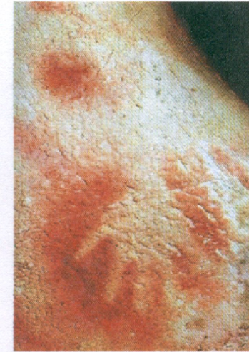
Оттиск человеческой руки. Палеолит. Пещера Пеш- Мерль, Франция

■ К древнейшим изображениям следует также отнести и оттиски человеческой руки с широко расставленными пальцами, обведенные контуром.