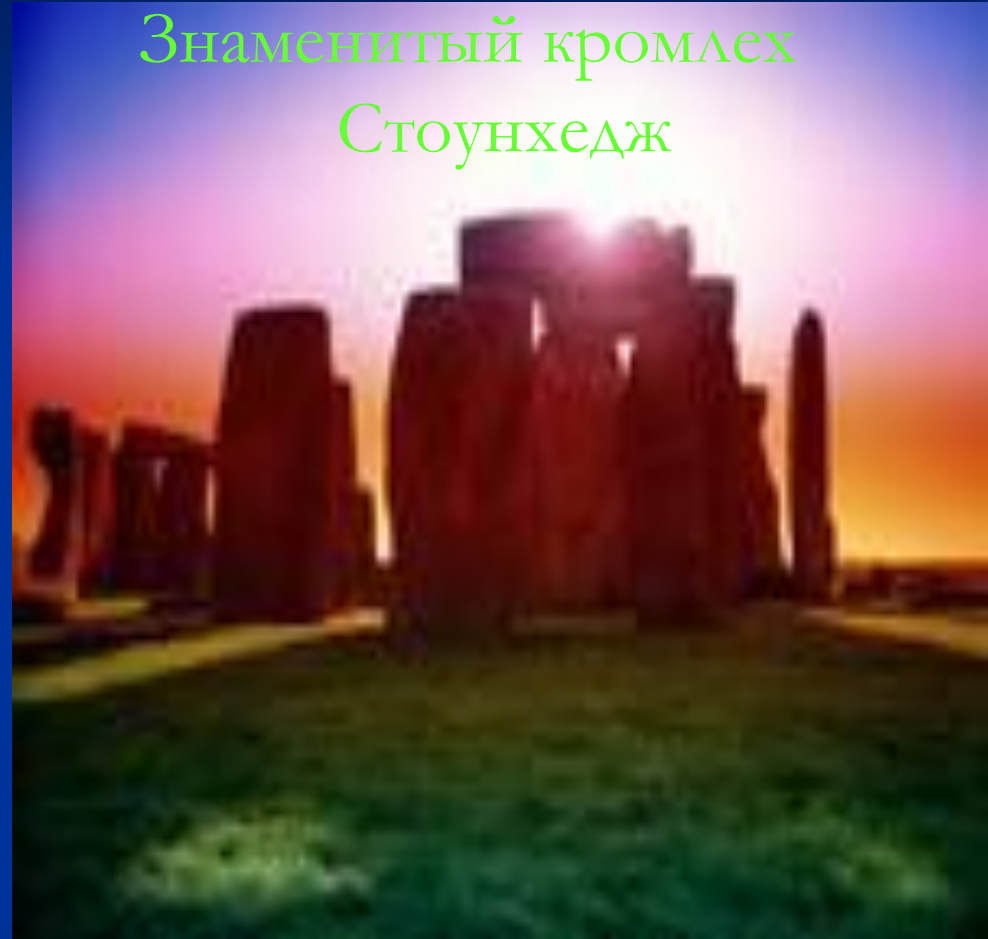
Знаменитый кромлех Стоунхедж