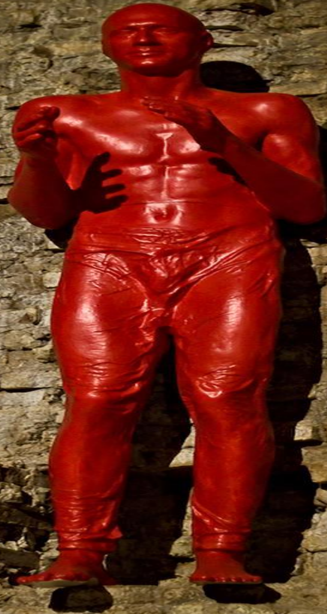
Экспонаты выставочных залов фестиваля: зал с этими скульптурами художники между собой называли "зала красных мужиков"