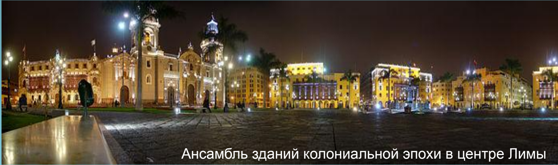
Ансамбль зданий колониальной эпохи в центре Лимы