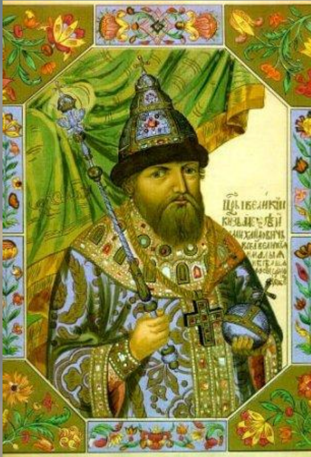
Царь Алексей Михайлович (1629 – 1676).

Традиция обмена крашеными яйцами на Пасху имеет в России давние корни. Известно, что во времена правления царя Алексея Михайловича для раздачи на Пасху было приготовлено до 37 тысяч яиц.