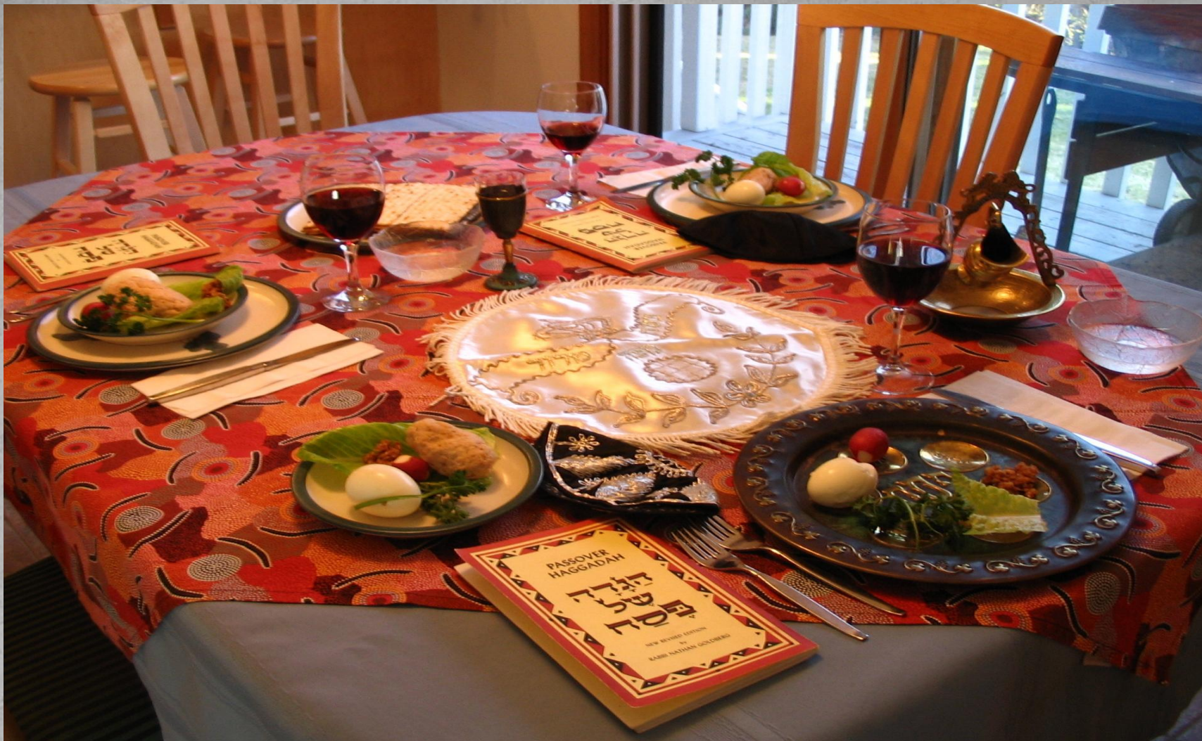
Один из видов украшения стола к встрече Песаха