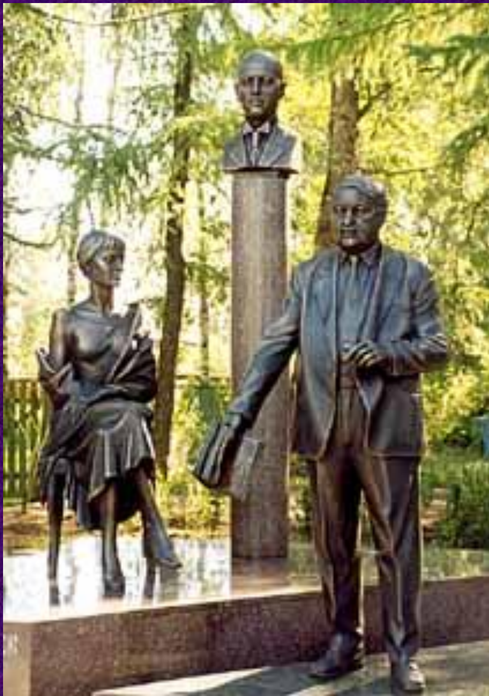
Скульптурная композиция «Семья Гумилевых» в Бежецке Автор: Андрей Ковальчук