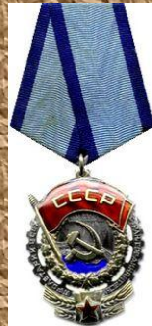
Орден Трудового Красного знамени