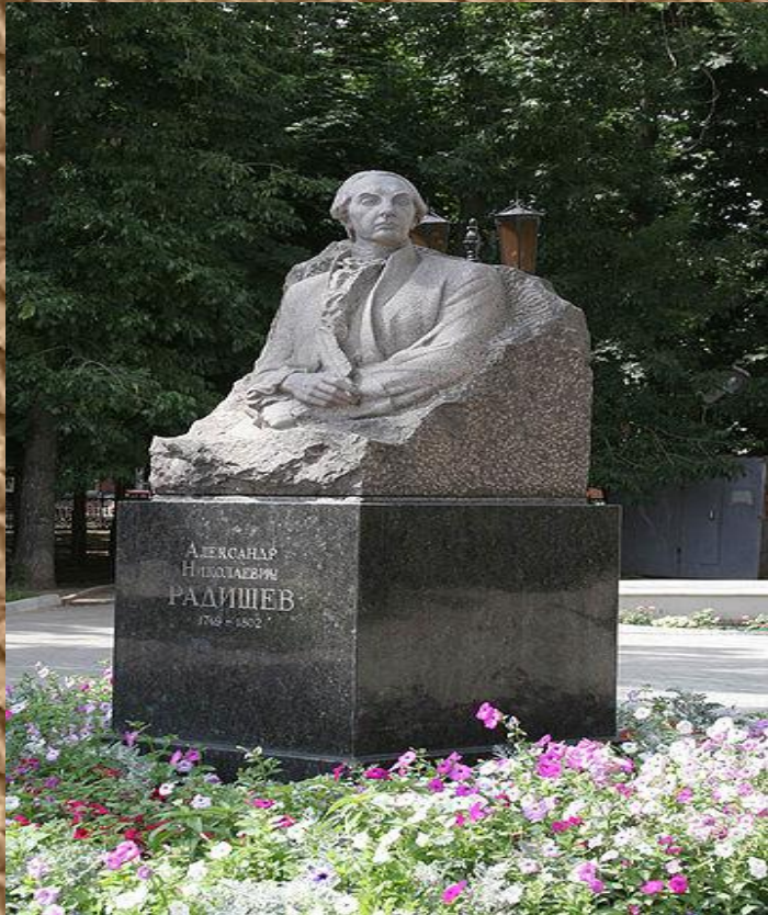
Памятник А. Н. Радищеву в Саратове