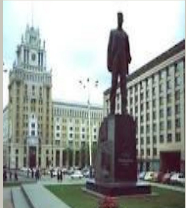
Памятник В. В. Маяковскому Москве