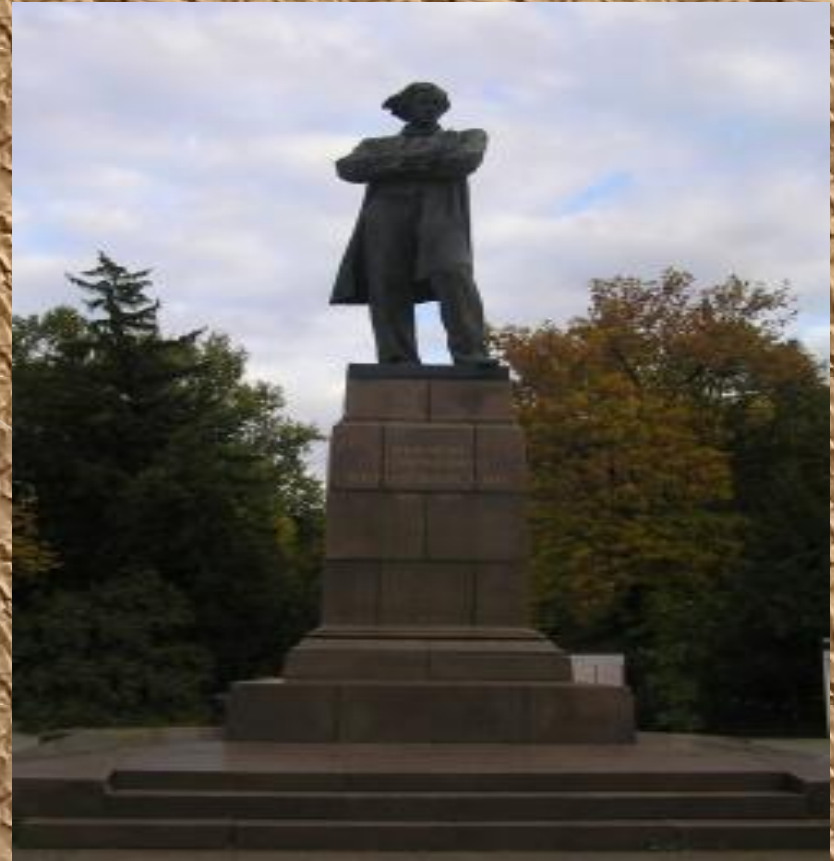
Памятник Н. Г. Чернышевскому в Саратове