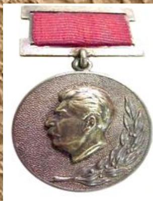
Сталинская премия второй степени (1951) — за скульптурный портрет И. В. Сталина , выполненный из гипса (1950)