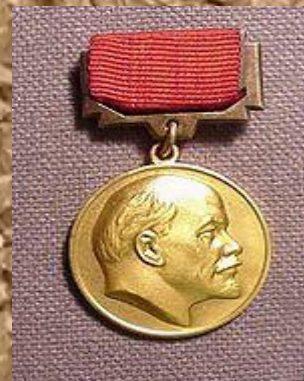
Ленинская премия (1959) — за памятник В. В. Маяковскому в Москве