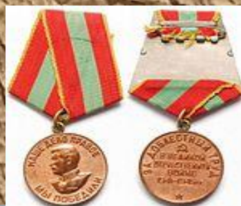
Медаль «За доблестный труд в Великой Отечественной войне 1941-1945 гг.»