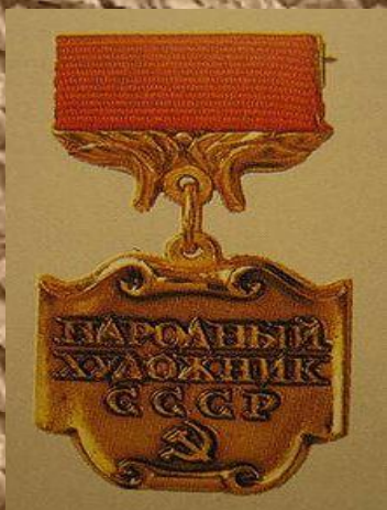
Нагрудный знак «Народный художник СССР»