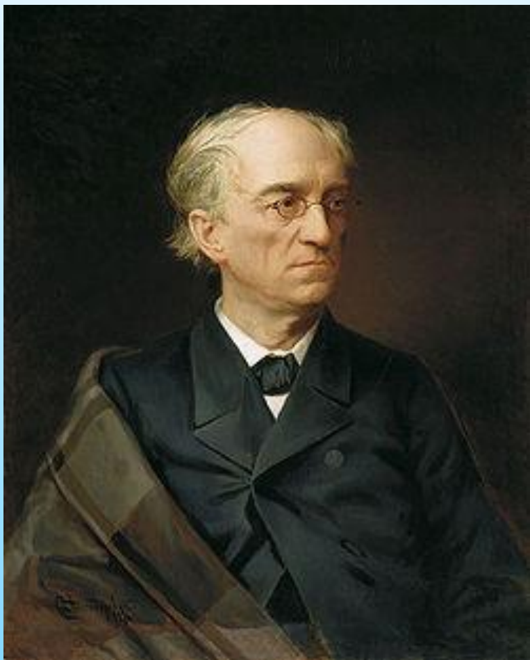
Ф.И.Тютчев , поэт XIX века