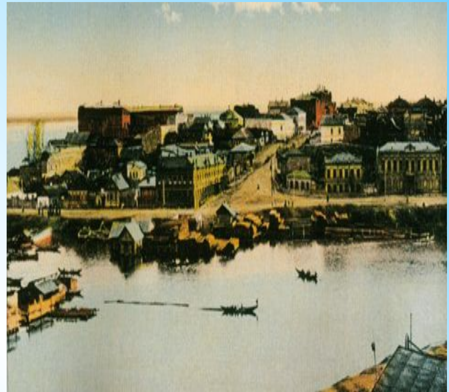
Казанская губерния во 2-й половине XIX века

Высказывания современника отмены крепостного права в одном из селений Казанской губернии