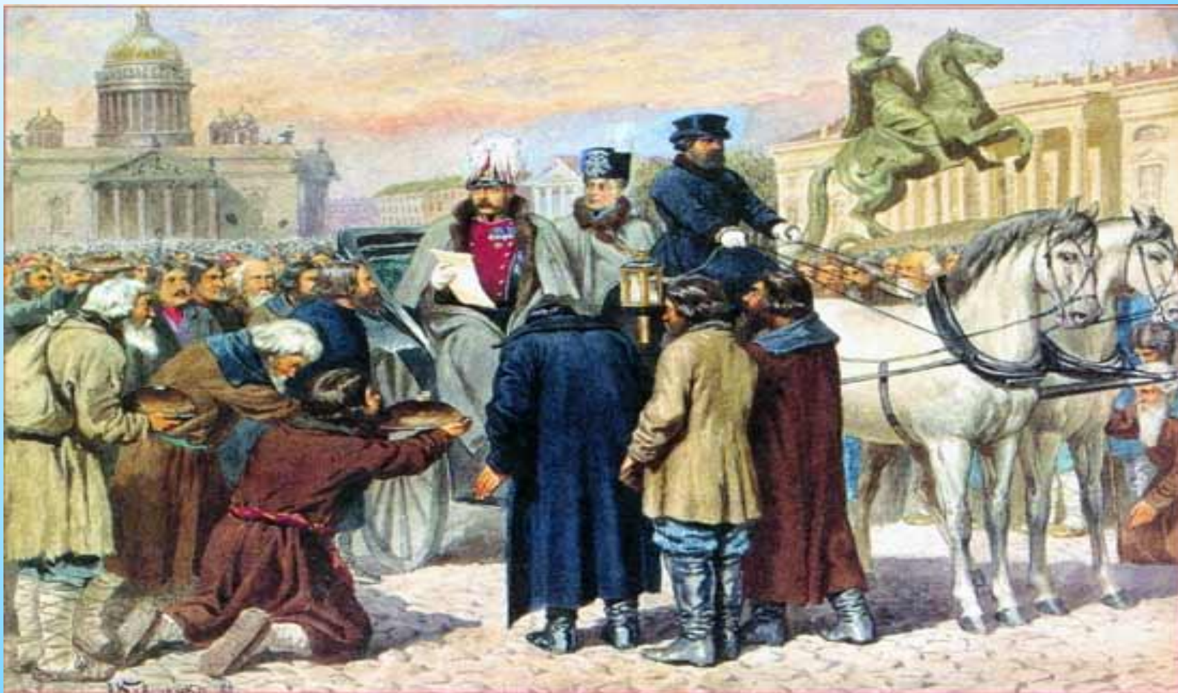
Чтение Манифеста 19 февраля 1861 года Александром II на Сенатской площади в Санкт-Петербурге. С картины художника А.Д. Кившенко